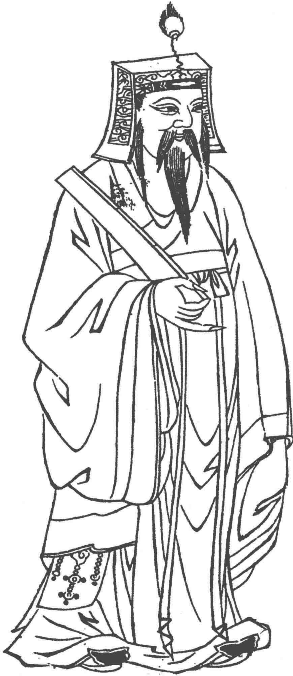
◎ 先儒王子（即王阳明）像，出自明代吕维祺编《圣贤像赞》。