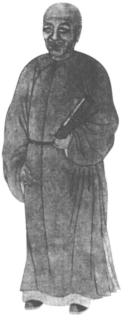
◎ 毛大可像，出自叶衍兰、叶恭绰编《清代学者象传》。

毛大可，即毛奇龄（1623—1716），字大可，号秋晴，浙江萧山人，清初经学家、文学家，世称西河先生，著有《王文成传本》两卷，编入《西河合集》。