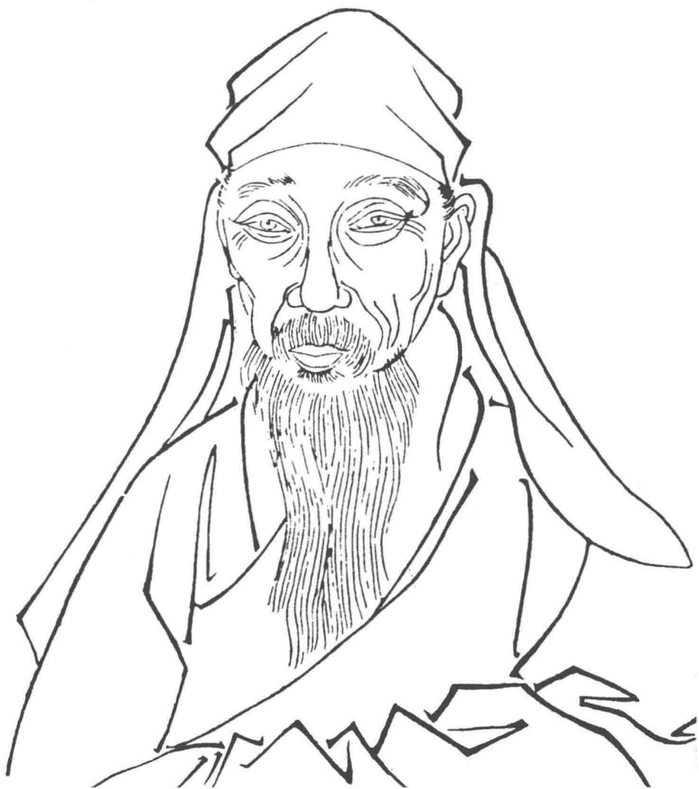
◎ 刘宗周像，出自明代张岱编《三不朽图赞》。

刘宗周（1578—1645），字起东，号念台，世称蕺山先生，绍兴府山阴（今浙江绍兴）人，明代儒学大师，蕺山学派的开创者，曾删定《阳明先生传信录》，编入《刘子全书遗编》。