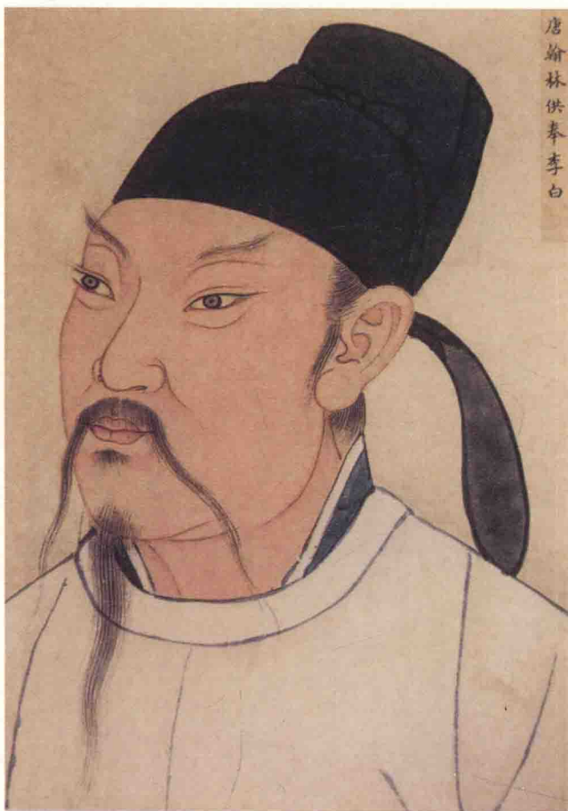
唐翰林供奉李白像 故宫南熏殿旧藏。