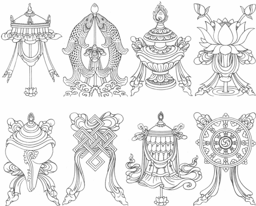
八瑞相：白伞，金鱼，宝瓶，妙莲（上排左起）；右旋白螺，吉祥结，胜利幢，金轮（下排左起）

物。第一个在佛陀前现身的是众神中的梵天神 ① 。他献给佛陀一尊千辐金轮，象征着请求佛陀通过“转法轮”传道。大天神因陀罗神 ② 随后现身，赠给佛陀一只巨大的白色海螺号，象征着请求他“宣喻佛法真谛”。在描绘佛陀得道的藏族绘画作品中，在传统上，黄色四面梵天神和白色因陀罗神的祈求形式是跪拜在佛陀宝座面前，献上他们各自的象征物。