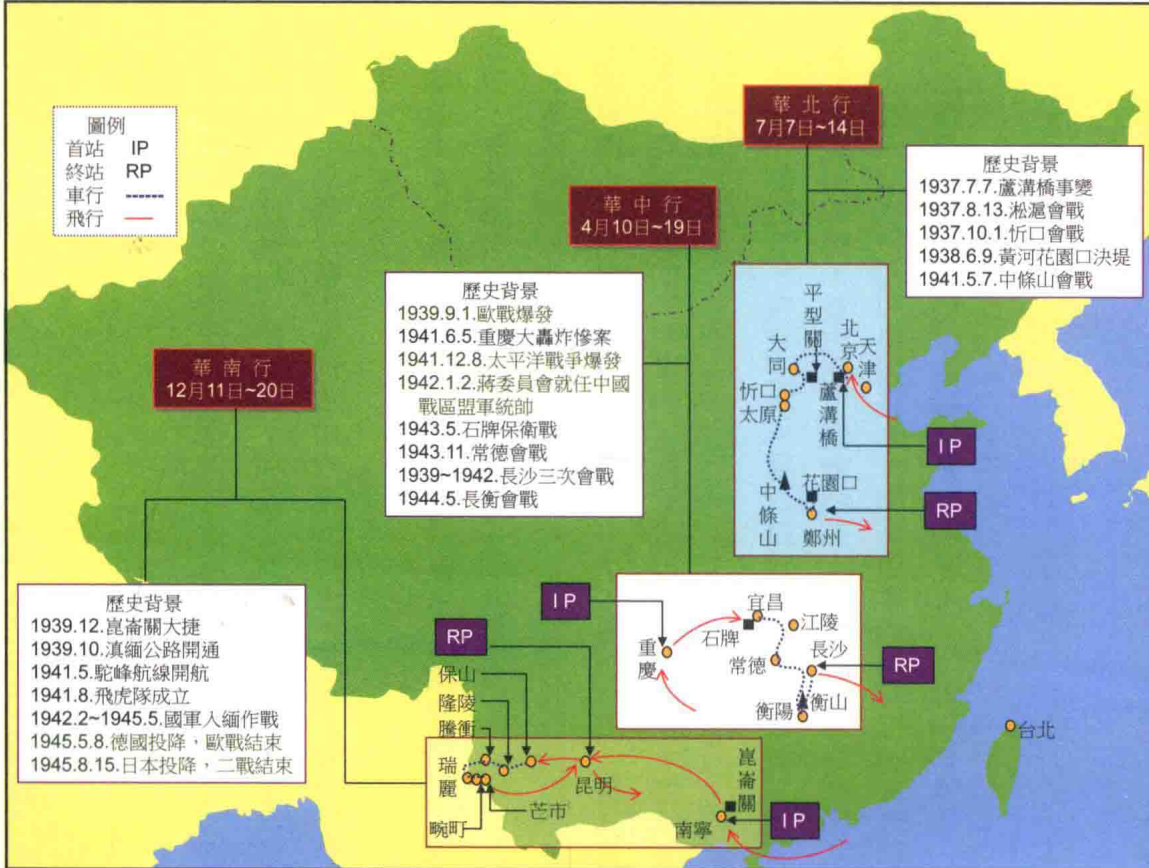
序圖：二〇一四年「重返抗日戰場」行程示意