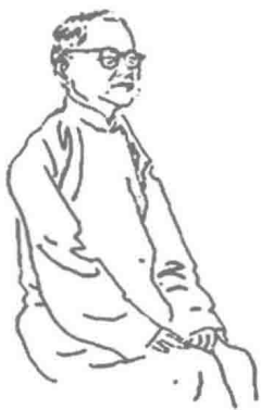
钱穆（1895~1990）：江苏无锡人，字宾四，我国著名国学家、历史学家。

我们这个民族经过了五千年的发展，中国文化经过了五千年的沉淀，凝聚形成了文化的核心——“礼”。礼仪是什么？钱穆说：“中华是礼仪之邦，礼是中华传统文化的核心。”