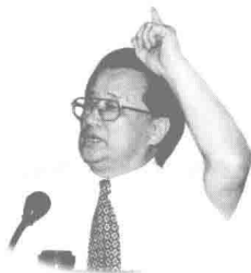
李燕杰：我国杰出的演讲家、著名教育艺术家，被誉为爱与美的化身、点燃心灵之火的人。

同志们讲，礼仪是学问，也是文章，回顾中华民族，伏羲氏画八卦、正婚嫁、建历法，均可视为中华民族的礼仪萌芽。咱们的祖先，从社会的人际关系出发，十分重视仁、义、礼、智、信，礼被视