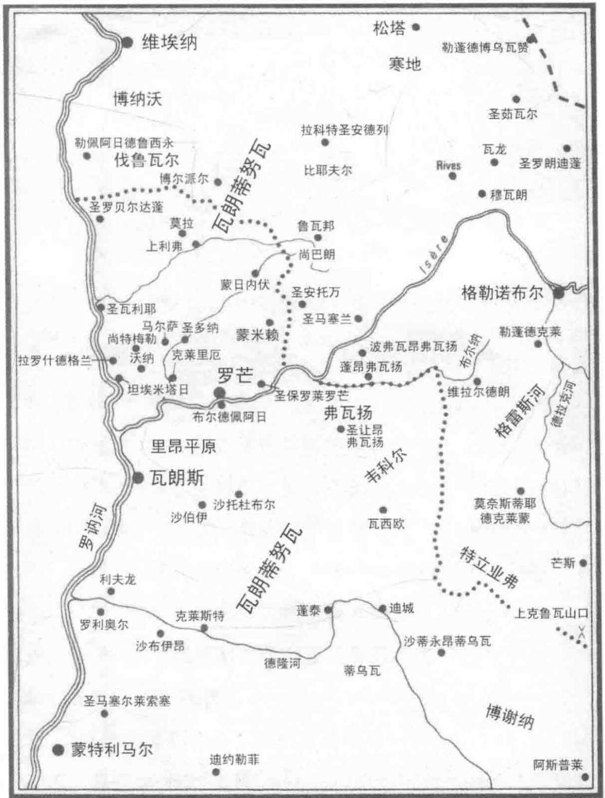
1579—1580 年间民众联会的中心地区