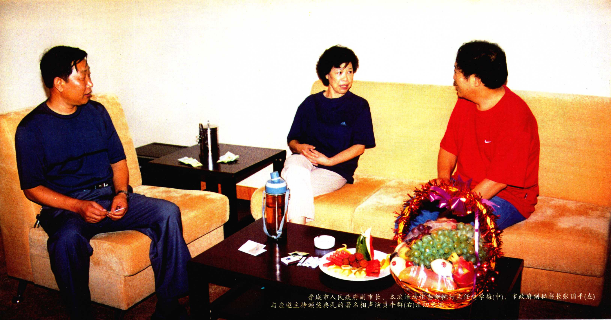
晋城市人民政府副市长、本次活动组委会执行主任赵学梅(中)、市政府副秘书长张国平(左)与应邀主持颁奖典礼的著名相声演员牛群(右)亲切交流