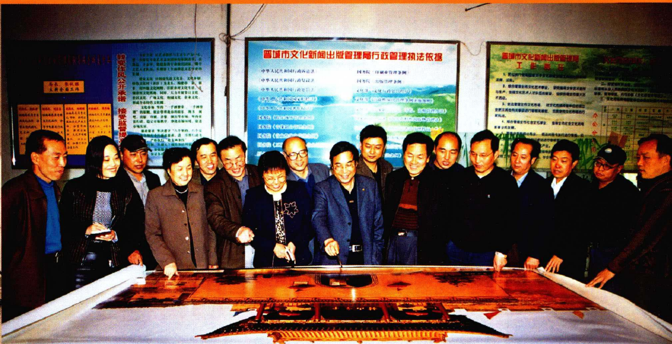
由晋城市文化新闻出版管理局各级领导干部组成的晋城国际摄影“金镜头”颁奖典礼事务管理委员会正在紧张的工作中。图为事务管理委员会组成人员在审定摄影作品