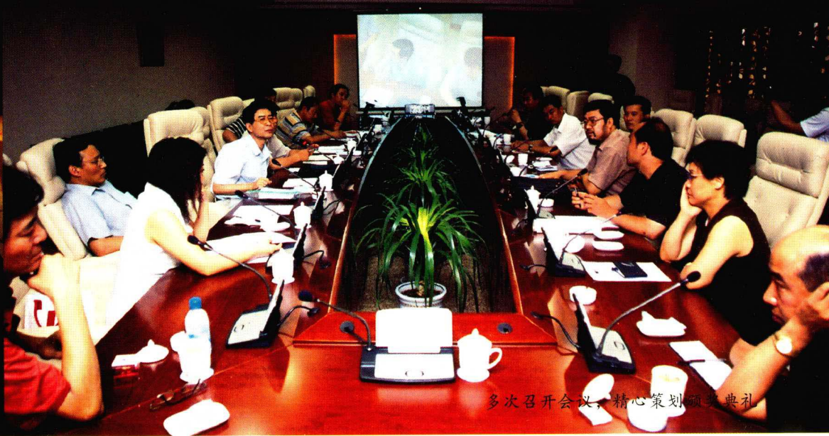
多次召开会议，精心策划颁奖典礼