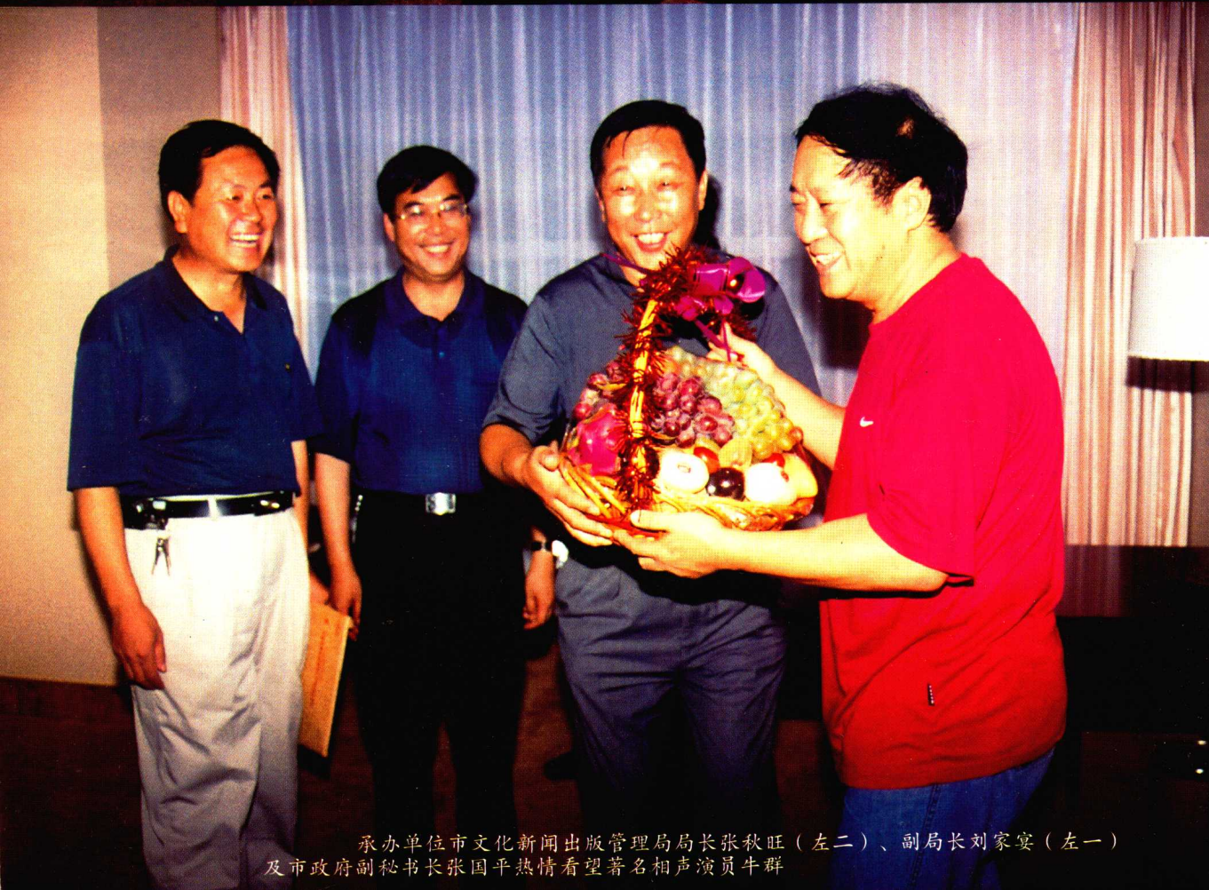
承办单位市文化新闻出版管理局局长张秋旺(左二)、副局长刘家宴(左一)及市政府副秘书长张国平热情看望著名相声演员牛群