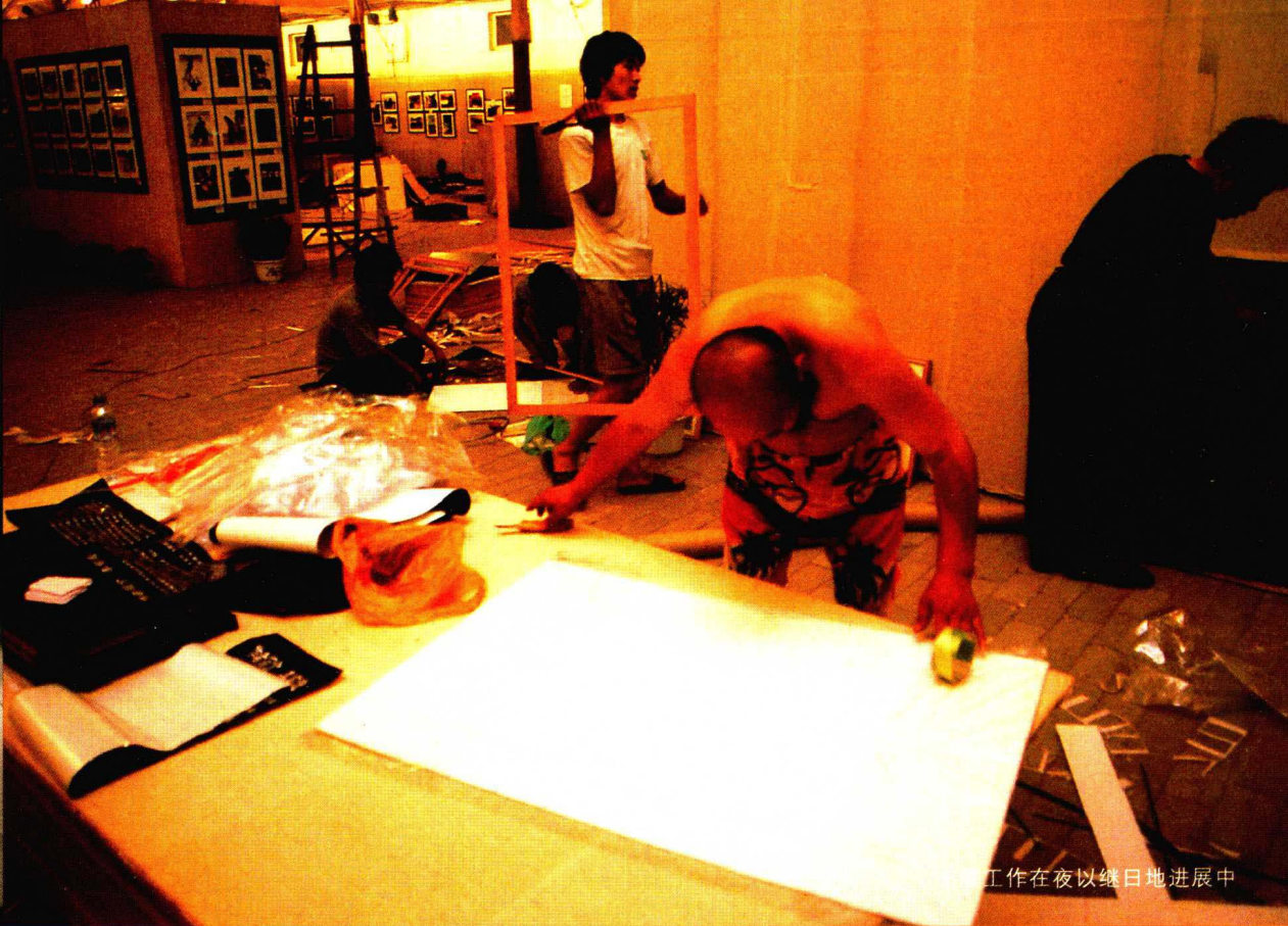
工作在夜以继日地进展中