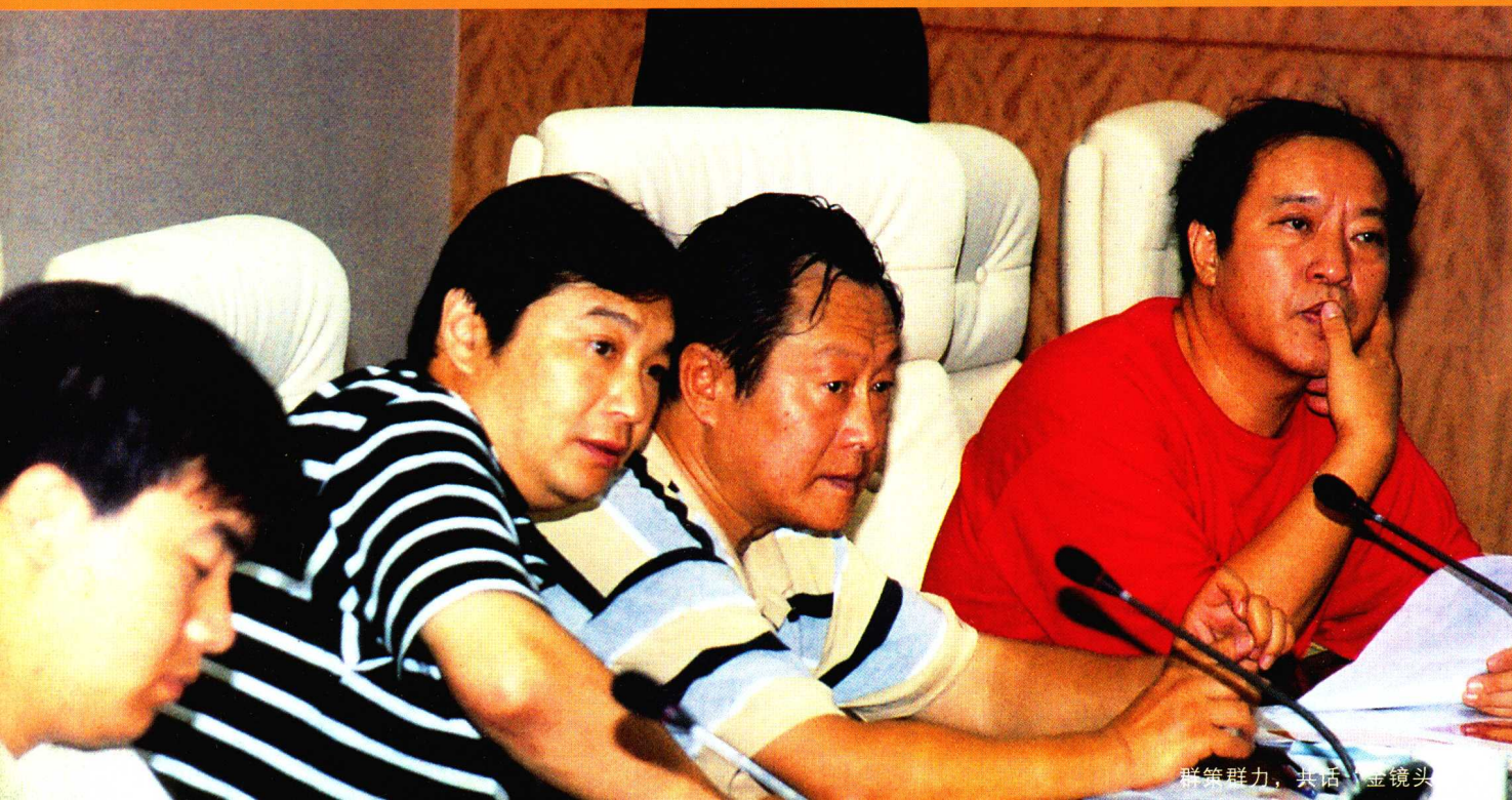
群策群力，共话“金镜头”

本次晚会的承办单位：晋城市文化新闻出版管理局，力争把这次活动做到“三个精彩”即：一、策划精彩。本台晚会的总策划和首席主持人由著名笑星、相声艺术家牛群担当。整场晚会场面宏大、气氛热烈、生动活泼，自始至终都洋溢着热烈、友好的气氛。策划方案突出摄影主题，以摄影家的甘苦为主线，向大家讲述图片背后的故事，引起全场人的共鸣。二、节目主题新颖，内容精彩。专门为此次活动创作的具有浓郁地方特色的节目迎宾舞蹈《激情·闪·闪》，上党梆子戏歌《我是一个摄影人》，少儿舞蹈《小小摄影家》，尾声歌舞《星光灿烂》等节目，在市梆子团、歌舞团、少儿艺术团的演员认真、到位、精彩的表演中把晚会推向一个又一个高潮。三、配乐精彩。典礼活动的配乐为晚会的一个亮点，在或激越，或雄壮，或低沉，或凝重的乐曲中，一幅幅精美的画面清晰地展示在观众面前，为图片增添了鲜活的生命力，为观众提供了视觉、听觉的双重享受。