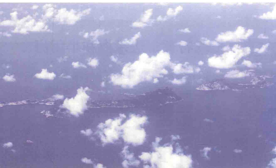
从空中俯瞰美丽的南海

侧通过马六甲海峡连接印度洋。南海北部连接的是中国领土广东、广西、海南、福建和台湾；东北端从广东省南澳到粤闽交界处，延至台湾岛南端一线与东海分界；东部和东南部邻近菲律宾群岛；南部则是马来西亚和文莱，包括加里曼丹岛等；西部和西南部邻接越南和马来半岛。