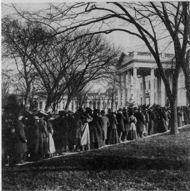
西奥多·罗斯福在新年接待美国民众