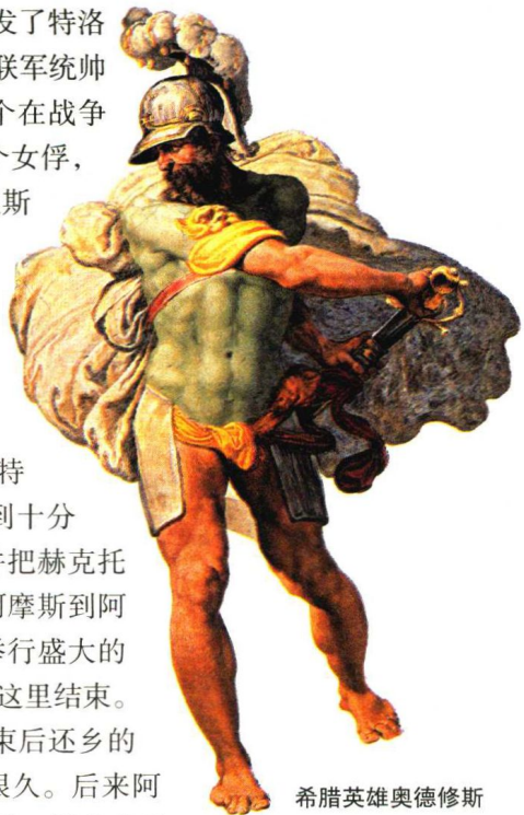
希腊英雄奥德修斯

斯巴达王墨涅拉俄斯的妻子——美丽的王后海伦，从而爆发了特洛伊与希腊之间长达10年之久的战争。到了第10年，希腊联军统帅阿伽门农和阿凯亚部族中最勇猛的首领阿喀琉斯争夺一个在战争中捕获的女子，由于阿伽门农从阿喀琉斯手里抢走了那个女俘，阿喀琉斯愤而退出战斗。《伊利亚特》的故事就以阿喀琉斯的愤怒为开端，集中描写那第10年里51天的事情。由于阿凯亚人失去最勇猛的将领，他们无法战胜特洛伊人，一直退到海岸边，抵挡不住伊利昂城主将赫克托尔的凌厉攻势。阿伽门农请求同阿喀琉斯和解，请他参加战斗，但遭到拒绝。阿喀琉斯的密友帕特罗克洛斯看到阿凯亚人将要全军覆灭，便借了阿喀琉斯的盔甲去战斗，打退了特洛伊人的进攻，但自己却被赫克托尔所杀。阿喀琉斯感到十分悲痛，决心出战，为亡友复仇。他终于杀死赫克托尔，并把赫克托尔的尸首带走。伊利昂的老王（赫克托尔的父亲）普里阿摩斯到阿喀琉斯的营帐去赎回赫克托尔的尸首，暂时休战，为他举行盛大的葬礼。《伊利亚特》这部围绕伊利昂城的战斗的史诗，便在这里结束。