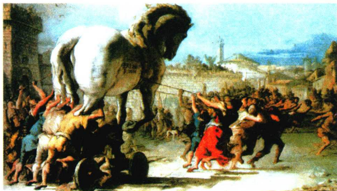
表现特洛伊战争的想象图

《伊利亚特》题名的原意是“伊利昂的故事”,写的是希腊人围攻特洛伊城的故事,当时的希腊人称特洛伊为“伊利昂”。关于这次战争的起因,在神话故事“不和的金苹果”里有详细的说明。