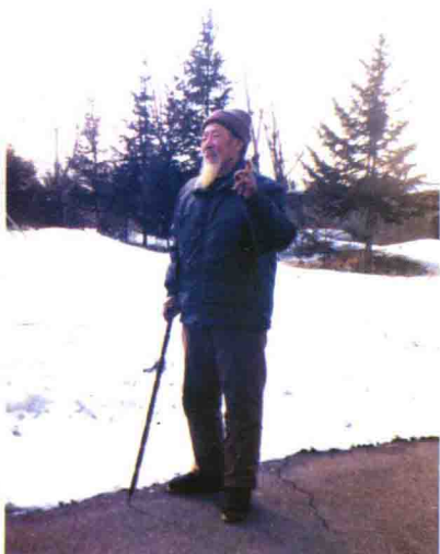
民间故事家讲述狩猎的故事