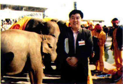
作者在昆明参加全国旅游会议