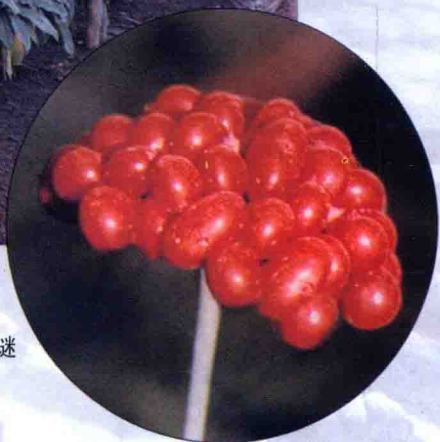
人参果多种颜色之谜