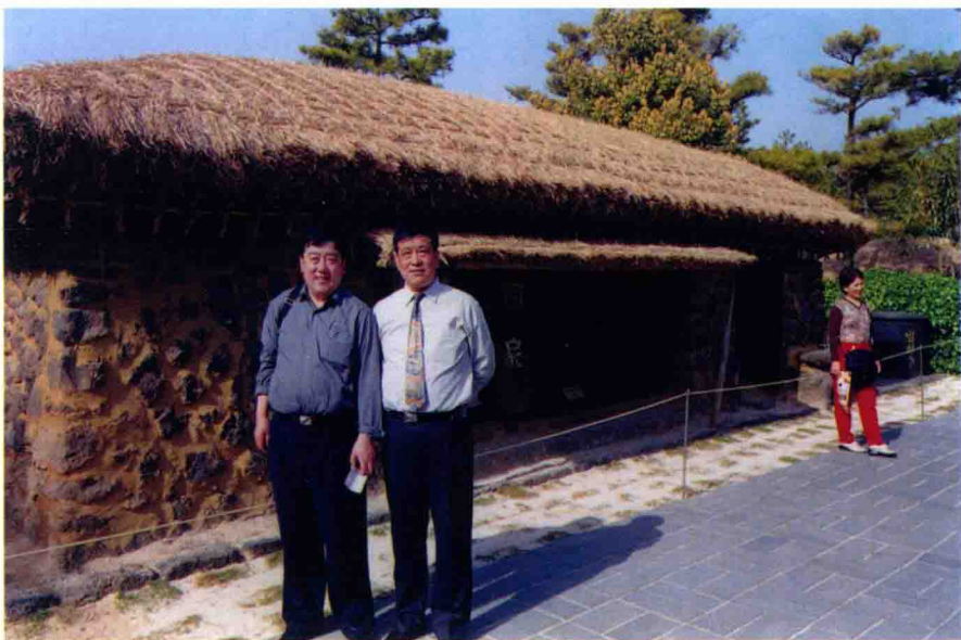
作者与抚松县领导赴韩国文化交流