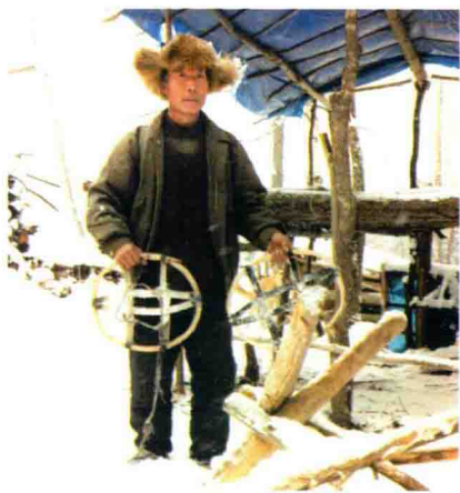
脚绑围圈救命之谜