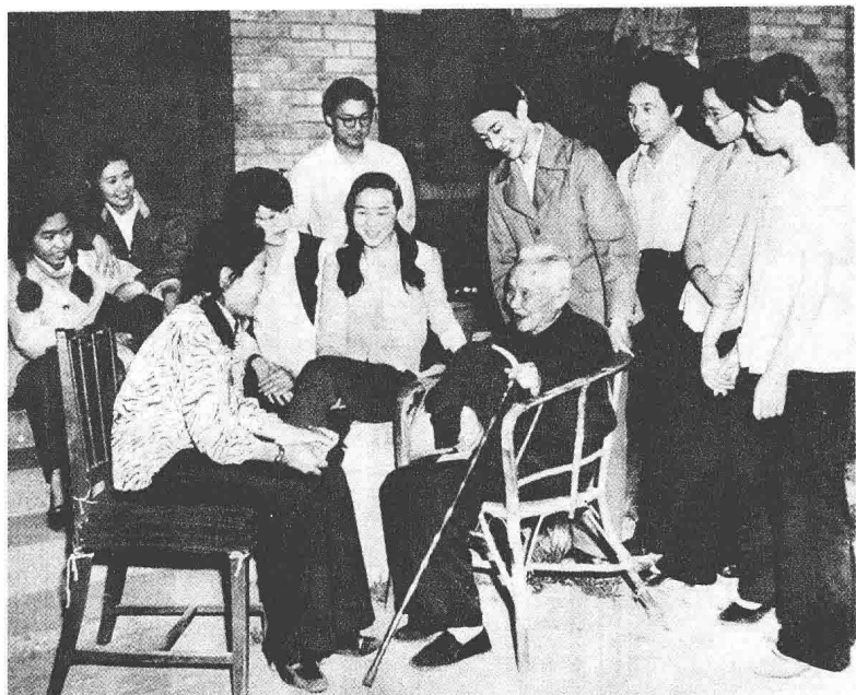
朱光潜同北大西语系学生亲切交谈