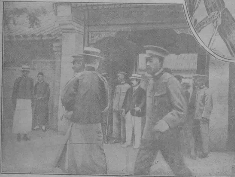
黎元洪臨走時出北京東廠胡同住宅當門中立者為黎氏。