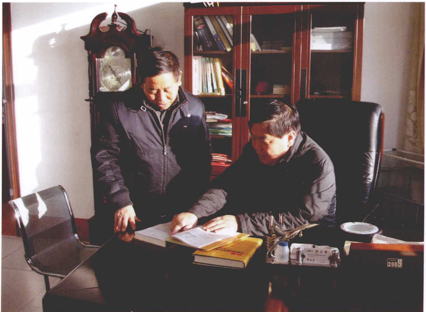
老友和臣像我的影子一样伴随着我完成了每一次采访，他应该成为本书的第二作者。