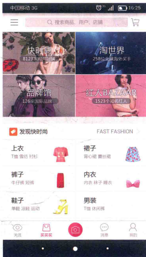
蘑菇街App买买买界面