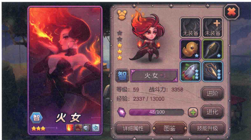
刀塔传奇 英雄详情界面