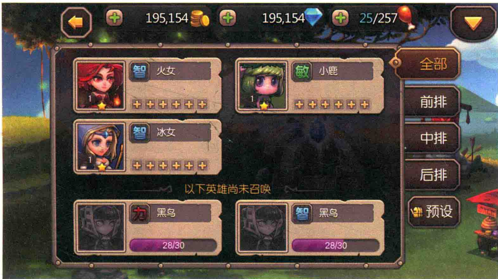
刀塔传奇 英雄列表界面