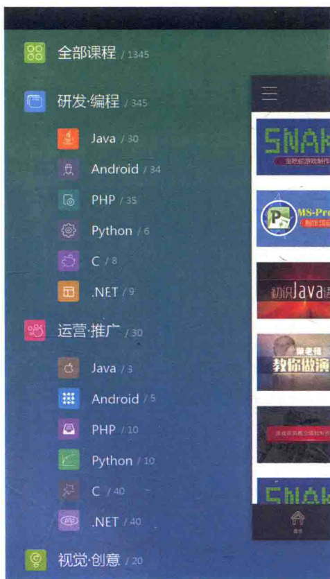
课工场App侧边栏界面