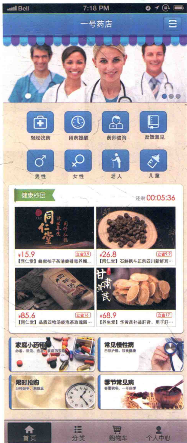
一号药店App首页界面