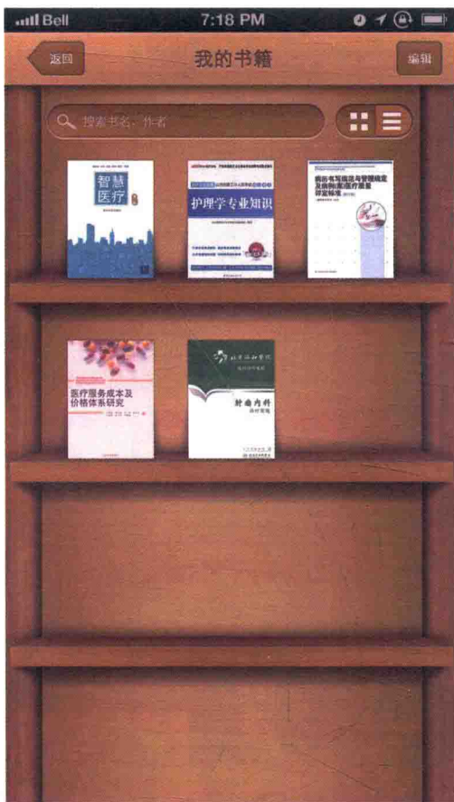
一号药店App书架界面