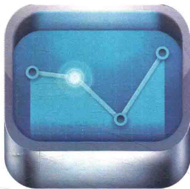
一号药店App启动图标