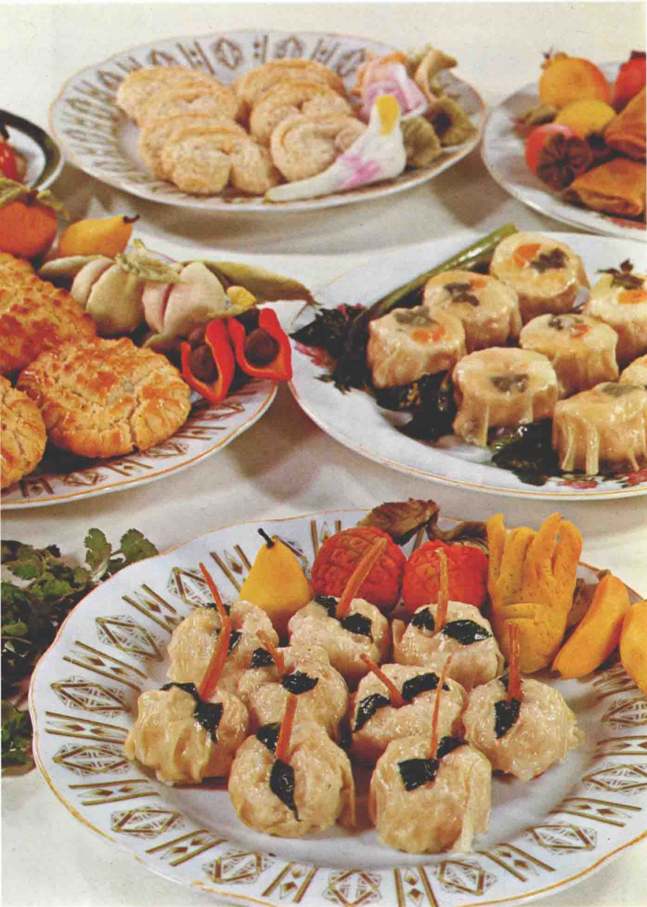
16 礼云子海棠及其他点心