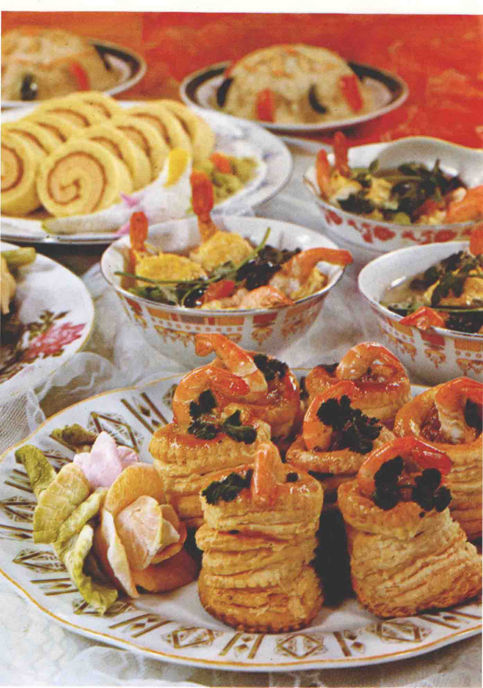
14 千层宝塔虾及其他点心