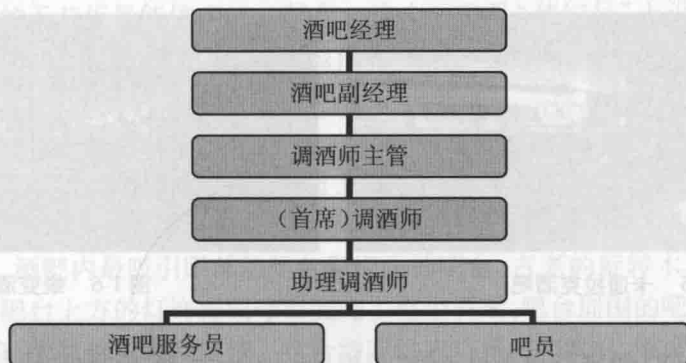
图 1-9 邮轮酒吧组织结构

根据邮轮吨位以及邮轮各部门之间配置的不同,邮轮上的酒吧和吧台数量有多有少。一般情况下,亚洲航线酒水服务工作量不大,酒水部全体人员为 40 人左右;而欧美航线的酒水服务工作量较大,人员配置为 60 人左右。具体组织结构见图 1-9。