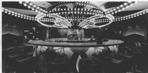
图 1-4 广场酒吧