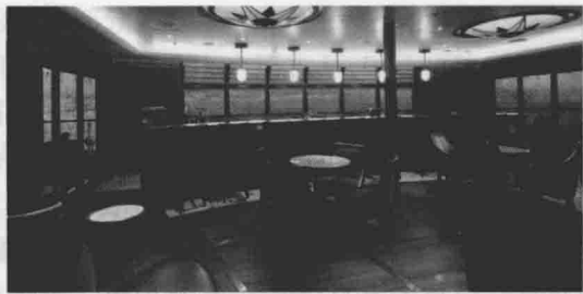
图 1-2 子午线酒吧