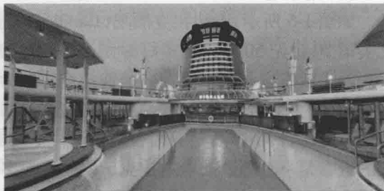
图 1-8 信号酒吧