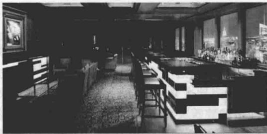
图 1-1 天际酒吧

如图 1-2 所示,子午线酒吧(Meridian)位于迪士尼邮轮“梦想号”的船尾,乘客可在用餐前来此小啜一口开胃酒刺激食欲或用餐后以利口酒为饮品增进用餐后的满足感,也可到毗邻的户外雪茄吧吞云吐雾一番,充分享受用餐后的愉悦心情。酒吧的装饰主要表达了对世界航海文化的崇敬,装饰图案以早期航海导航工具为原型,如地板上镶嵌着一个巨大的六分仪图案,玻璃墙面上绘有盖着世界各地护照印章的航海图,天花板上闪烁的灯饰勾勒出一幅奇妙的星座图等。鲜明的航海元素以及舷窗外浩瀚的大海不禁令人对航海者的智慧和勇气肃然起敬。为了维护这种肃穆的气氛,酒吧制订了着装规范,要求男士穿正装长裤和衬衫,女士穿裙装或裤套装,穿泳衣或背心者不许入内。