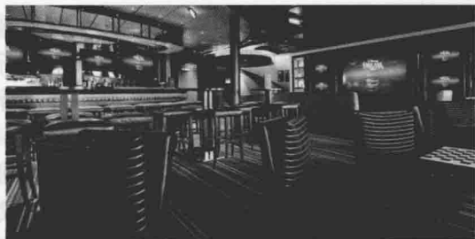
图 1-7 687 酒吧

如图 1-8 所示,信号酒吧(Signals)是迪士尼邮轮“魔力号”上的池畔吧,酒吧于中午营业至晚上 9 点,只对 21 岁以上的顾客开放,供应冰镇鸡尾酒、啤酒、咖啡和小吃。整个酒吧与上方的圆柱形建筑物及其两侧的航海彩旗浑然一体,就像一座在浩瀚大海上给过往船只指引方向的灯塔。这是一个温馨惬意的地方,乘客可坐在吧内在柔和的背景音乐中享用清凉的酒水 and 美味小食,也可到吧外的池畔享受日光浴促使自己的肌肤变成健康的棕褐色,同时还能欣赏到美丽的海景。