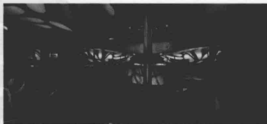
图 1-6 蜕变酒吧