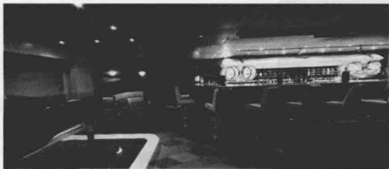
图 1-5 凯迪拉克酒吧

如图 1-6 所示,蜕变酒吧(Evolution)是迪士尼邮轮“梦想号”上的舞蹈俱乐部酒吧,白天它是舞蹈培训、宾戈游戏和工艺美术展等活动的场所,晚上则是成人跳舞、嬉戏、卡拉 OK 和饮酒的天地。设计灵感源自大自然中极美丽的有翼生物,是对一只黑脉金斑蝶蜕变的艺术诠释。蝴蝶翼图案装饰的墙壁,象征着飞舞中的蝴蝶的旋转吊灯,营造出超凡脱俗的氛围,令人有一种破茧而出的感觉。这是一个时尚、炽热的动感地带,在劲歌热舞的感染下让人无法抵挡美酒的诱惑。歌、舞、酒的完美结合促使人从被束缚的蝶蛹蜕变成自由飞舞的蝴蝶,让人尽情怒放自己的生命,充分享受短暂而精彩的人生。