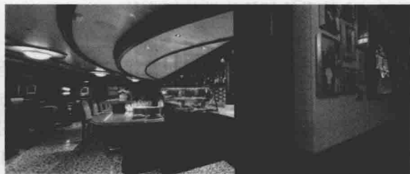
图 1-3 海湾咖啡屋