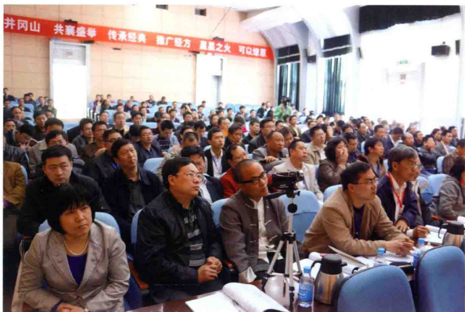
图 4 学员认真聆听