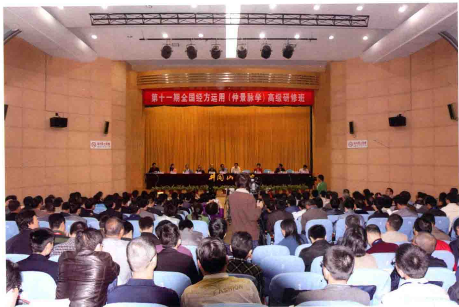
图 2 开幕式现场