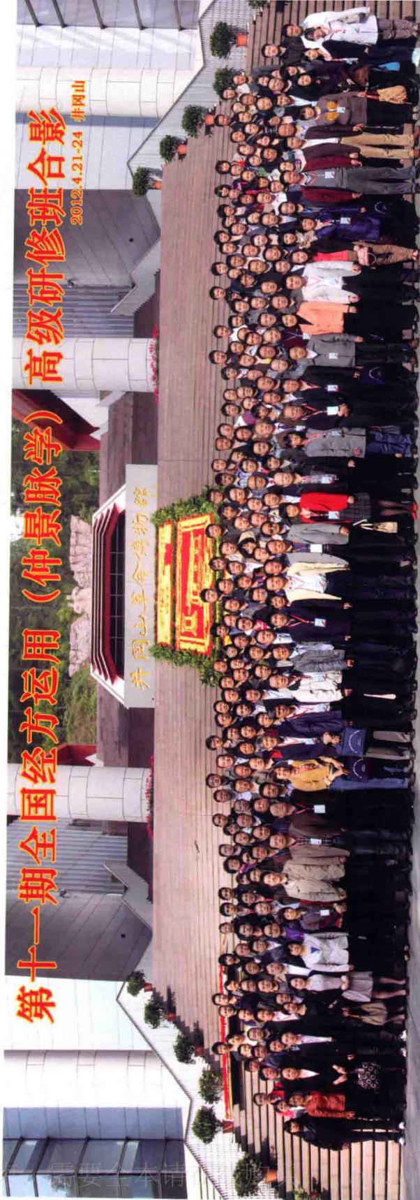
图1 第十一期全国经方临床运用高级研修班