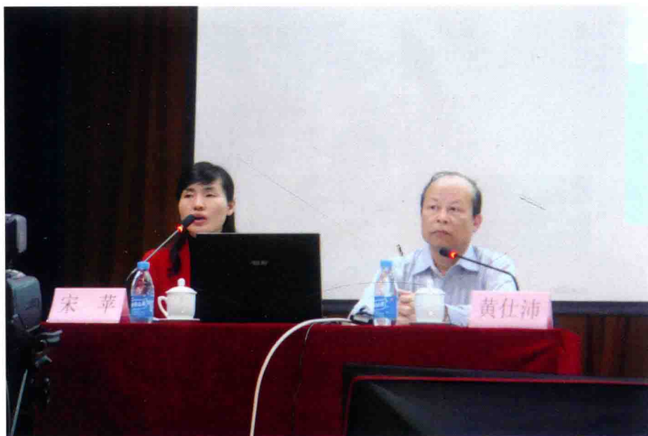
图 10 黄仕沛教授演讲