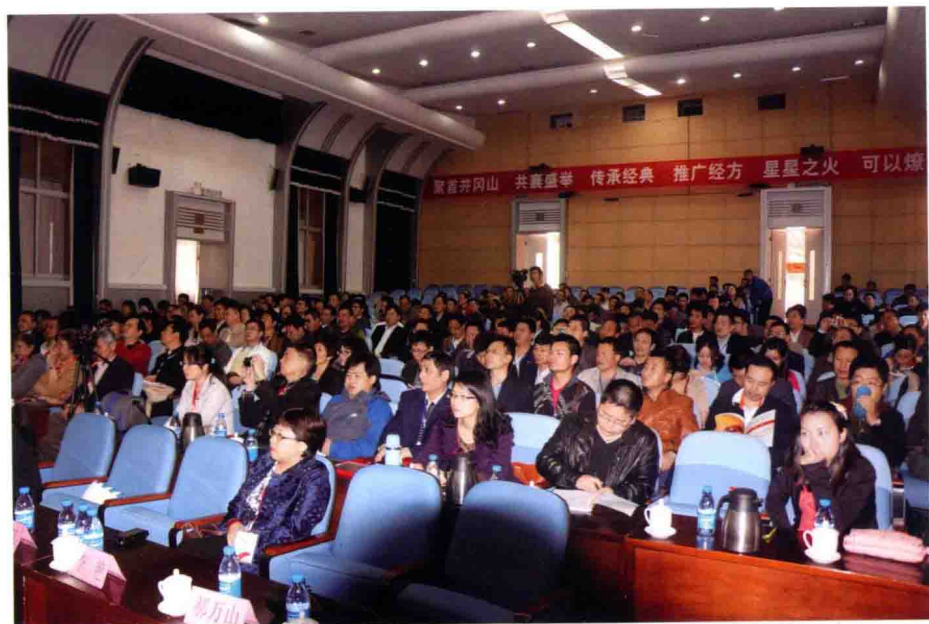
图 3 会场一隅