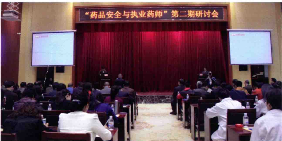
2014年11月13日，“药品安全与执业药师” 第二期研讨会，广州