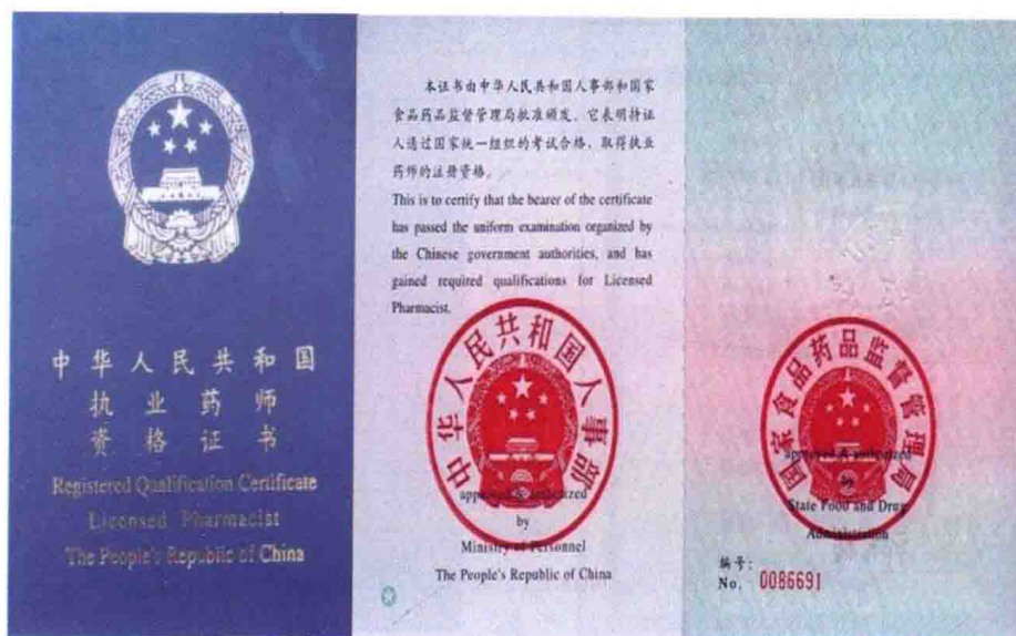
执业药师资格证书