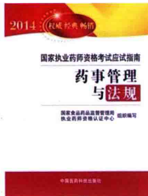
2007 年、2011 年、2014 年国家执业药师资格考试应试指南——药事管理与法规