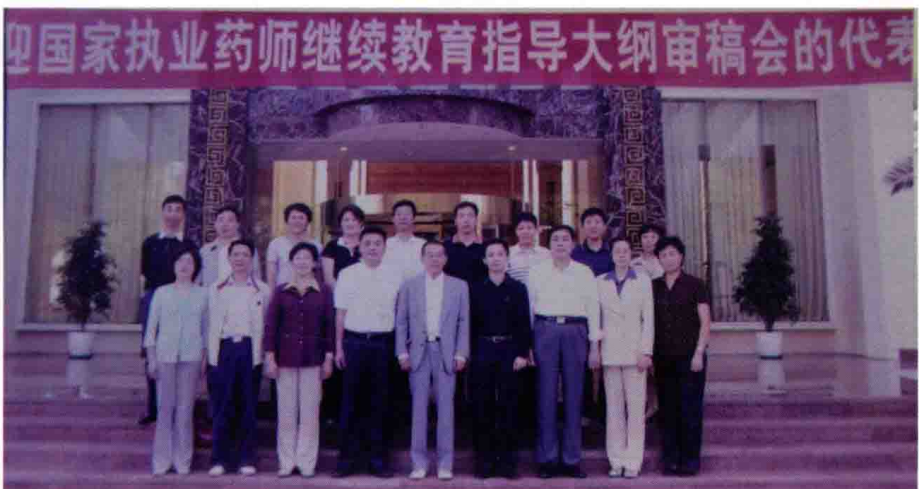
2006年10月，国家执业药师继续教育指导大纲审稿会，贵阳