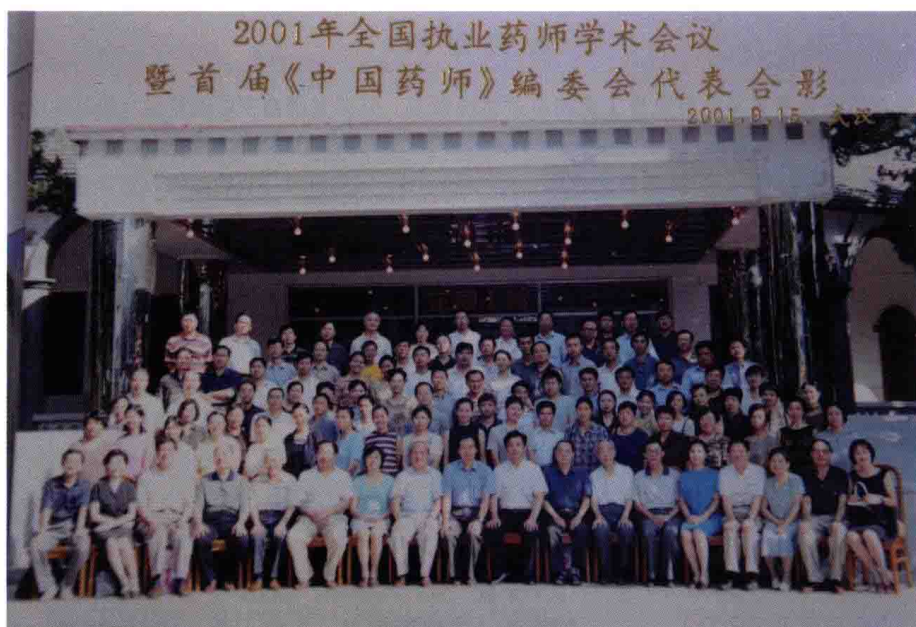
2001年9月15日，全国执业药师学术会议暨首届 《中国药师》编委会，武汉