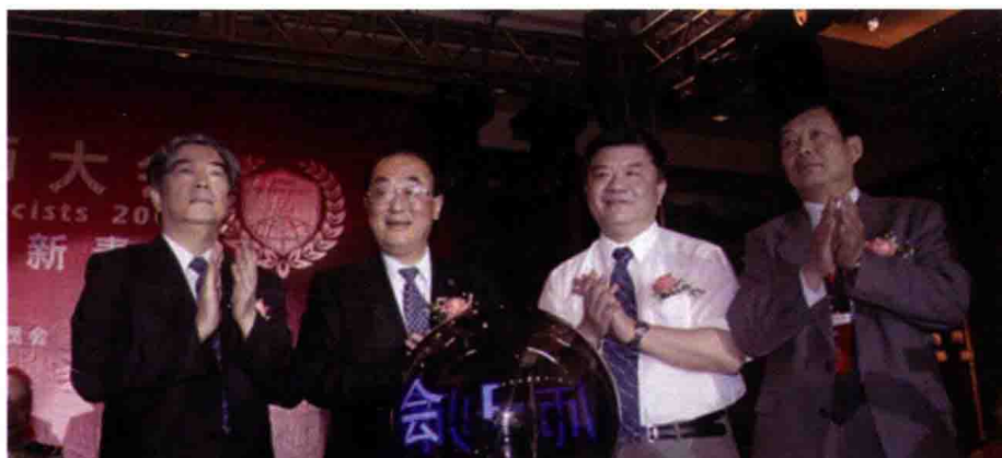
2009年6月6日，在首届中国药师大会上，邵明立（左一）、高强（左二）、陈竺（左三）、张文周（左四）共同为中国药师大会会徽揭幕