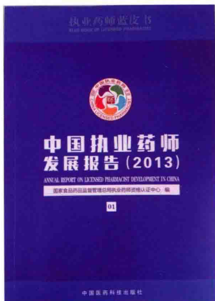
《中国执业药师发展报告 (2013)》(蓝皮书)