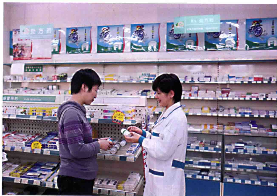
执业药师开展药学咨询服务（取自《确保公众饮食用药安全》）