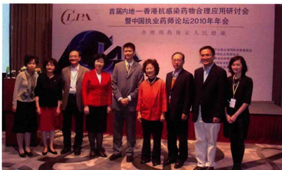
2010年11月28日，首届内地—香港抗感染药物合理应用研讨会暨中国执业药师论坛2010年年会，香港