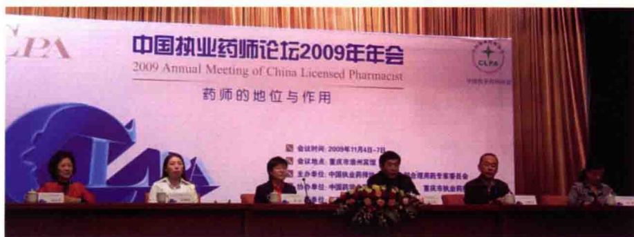
2009年11月4~7日，中国执业药师论坛2009年年会，重庆