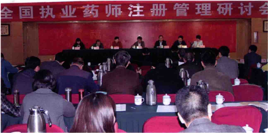
2014年3月20日，全国执业药师注册管理研讨会，成都