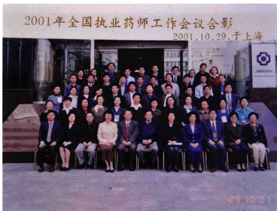
2001年10月29日，全国执业药师工作会议，上海