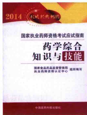
2014 年国家执业药师资格考试应试指南（药学类）药专业知识（一）、药专业知识（二）、药学综合知识与技能