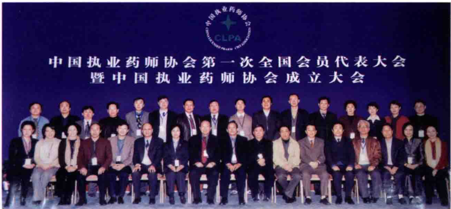
2003年2月22日，中国执业药师协会第一次全国会员代表大会暨中国执业药师协会成立大会（部分理事合影），北京