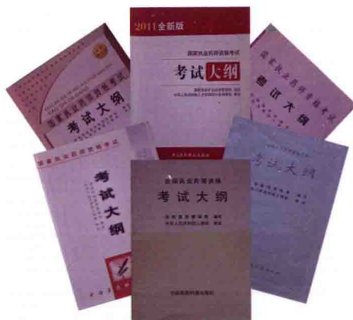
六版国家执业药师资格考试大纲