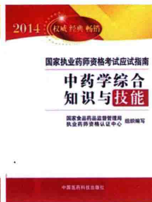
2014 年国家执业药师资格考试应试指南（中药学类）中药专业知识（一）、中药专业知识（二）、中药学综合知识与技能