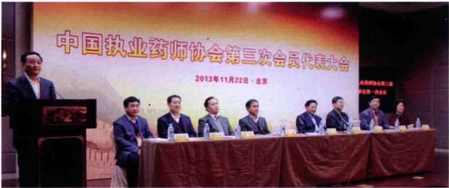
2013年11月22日，中国执业药师协会第三次会员代表大会，北京