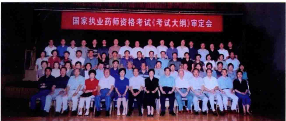
国家执业药师资格考试2007版考试大纲审定会，2006年，北京