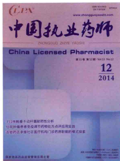
《中国执业药师杂志》 创办 11 年