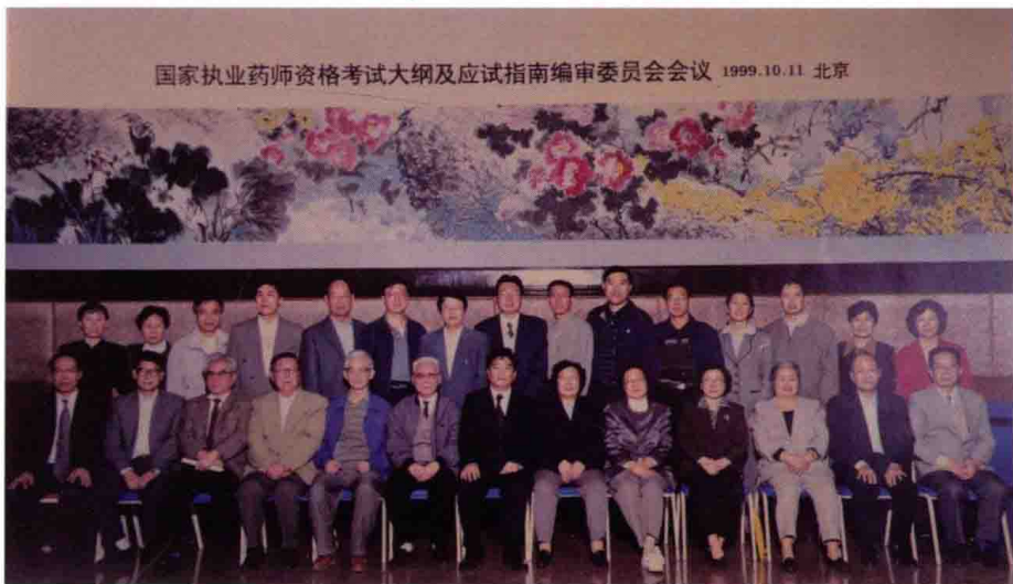
1999年10月11日，国家执业药师考试大纲及应试指南编审委员会会议，北京

2001年7月13日，人事部、卫生部、国家药品监督管理局印发了《执业药师资格（药品使用单位）认定办法》