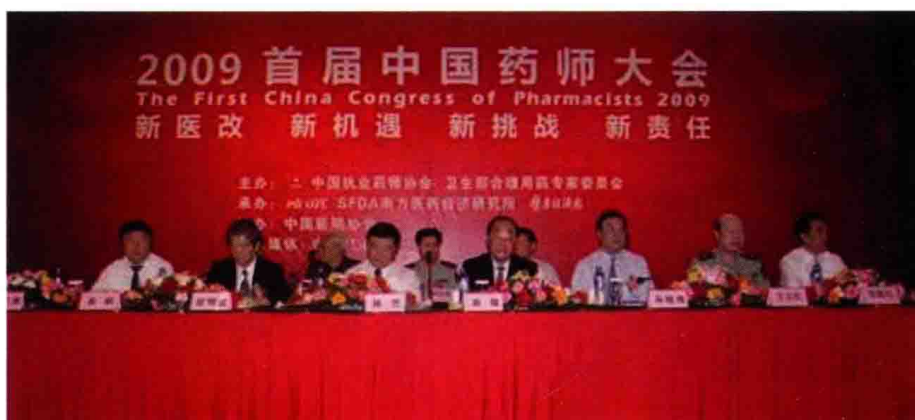
2009年6月6日，中国执业药师协会主办的首届中国药师大会，北京