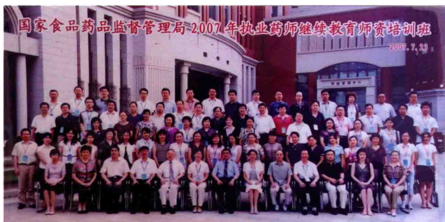
2007年7月23日，国家食品药品监督管理局2007年执业药师继续教育师资培训班，上海