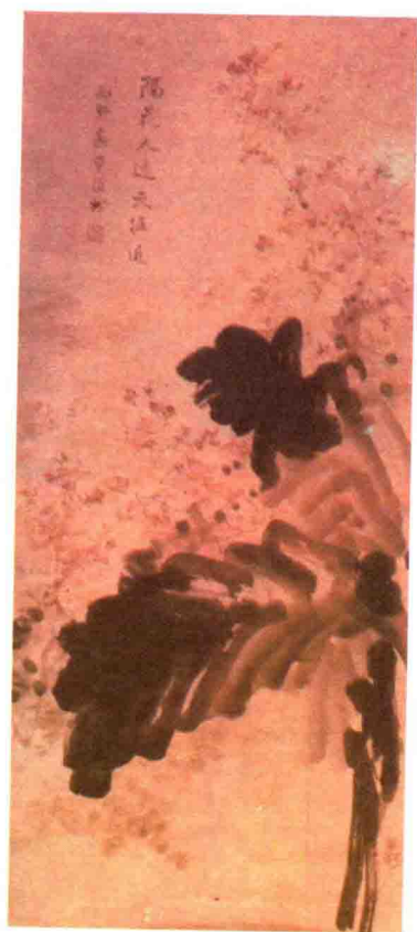
邓云乡藏王西野画《怡红诗境图》