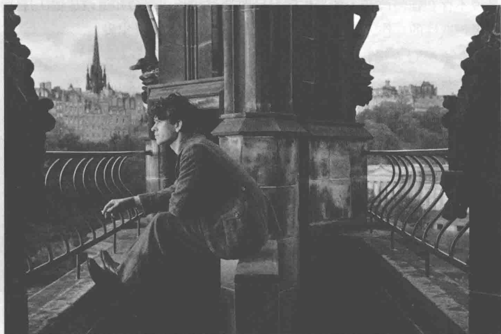
《云图》（Cloud Atlas, 2012）

书一开篇就提出“强化故事和结构”这一主题，并指出“强化故事和结构”是电影创作中不可或缺的一部分。它不仅关系到故事的吸引力，更关系到影片的整体质量和观众的观影体验。在创作过程中，导演需要通过精心构建故事线、设置冲突和悬念，来吸引观众的注意力，并引导他们深入理解影片的主题和人物。同时，结构的强化也有助于提升影片的节奏感和观赏性，使观众在观影过程中获得更加愉悦和深刻的体验。