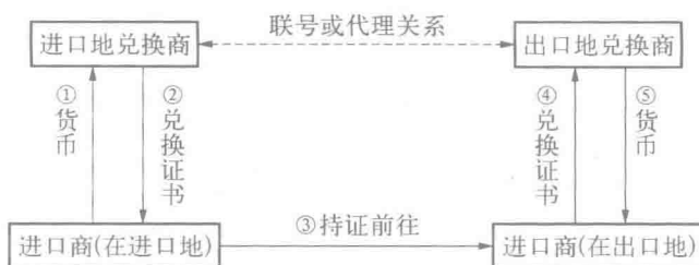
图 1-1 兑换证书的基本流程

兑换证书由进口地兑换商开出,以该进口商(或出口商)为收款人,以出口地兑换商为付款人,由该进口商持至出口地凭此证兑取货币。