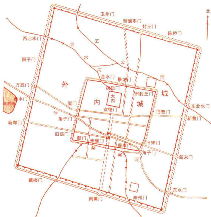
北宋东京外城和内城示意图

东京的外城又称“新城”或“罗城”，由后周世宗所筑，周长四十余里。北宋时，统治者对东京进行了多次修复和加固，使其成为拱卫京师的首道屏障。东京的城壕名为“护龙河”，宽十几丈，内外都种着杨柳树。城墙和城壕之间有“羊马城”，这是一种防御性的城