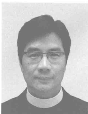
東九龍教區 郭志丕主教