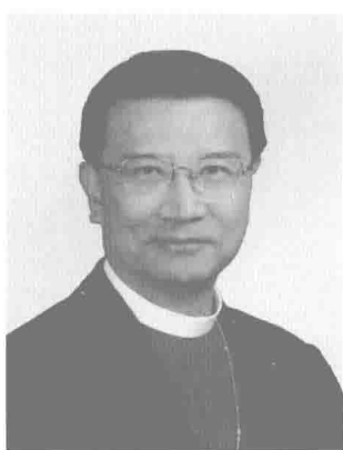
東九龍教區 徐贊生榮休主教