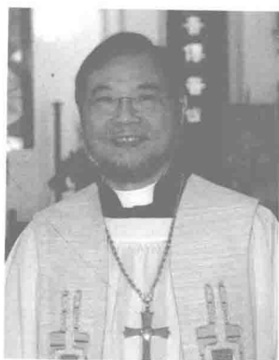
西九龍教區 蘇以葆榮休主教