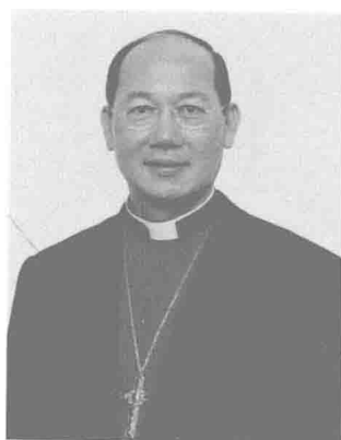
香港聖公會教省主教長 鄺保羅大主教