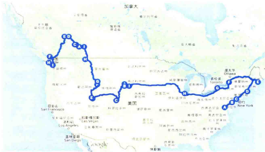
图 1—2 北美“长征”路线图（第一段：华盛顿—西雅图）