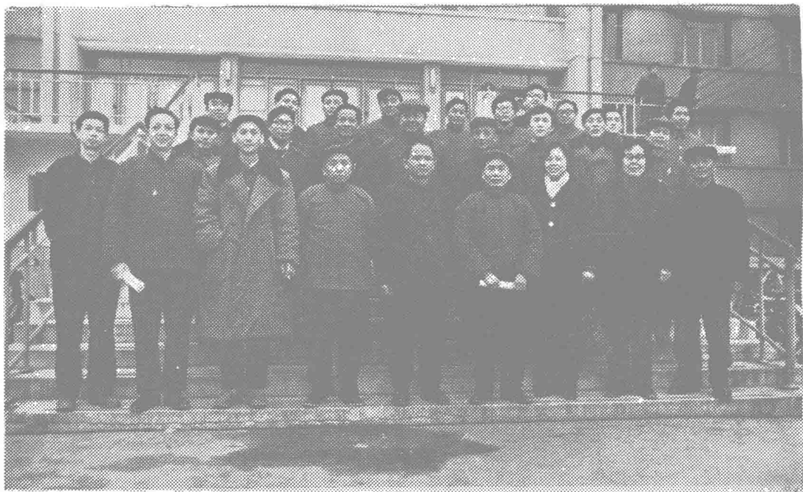
贵州省月亮山区域民族综合考察队全体同志合影