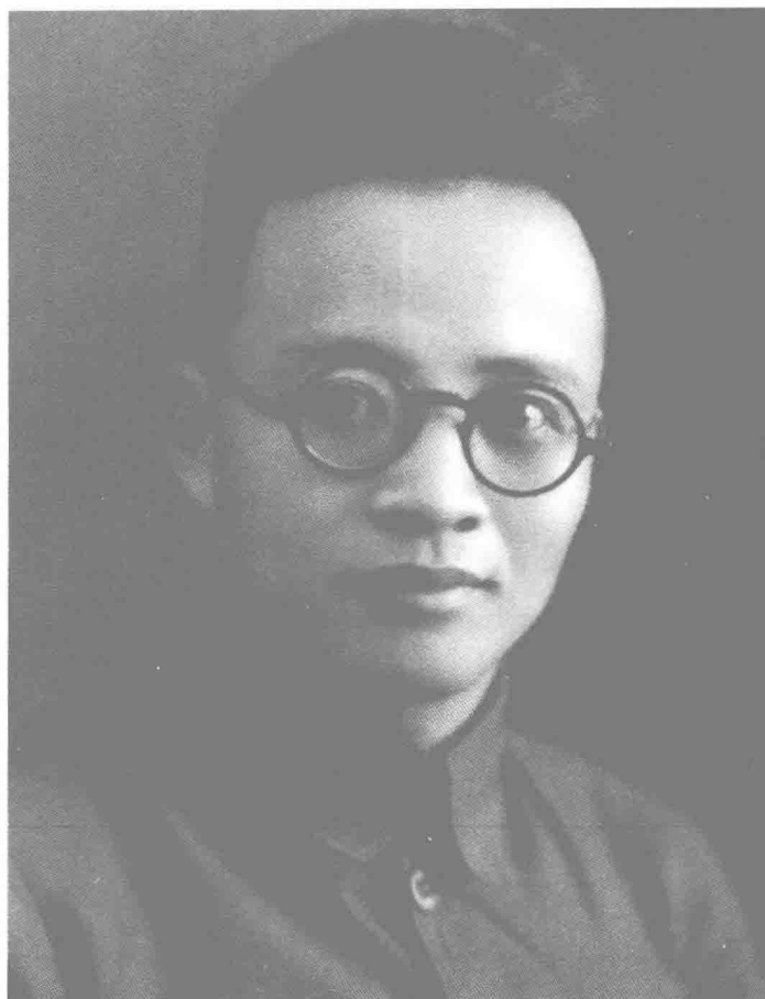
秦邦宪（1907—1946），又名博古，江苏无锡人。中国共产党在民主革命时期的重要领导人之一，著名的马克思主义理论家和宣传家，坚定的无产阶级革命家。其一生，由爱国而走向革命，最终转向马克思主义。