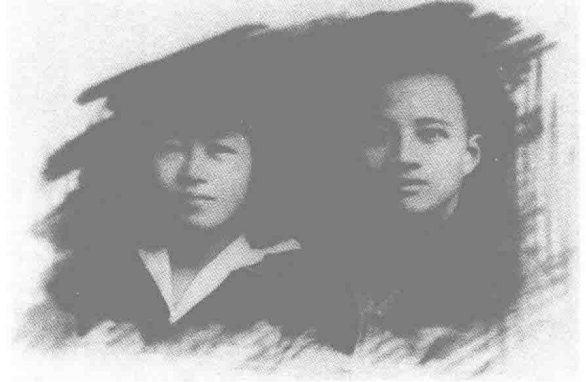
1928年5月，秦邦宪与刘群先在苏联结婚