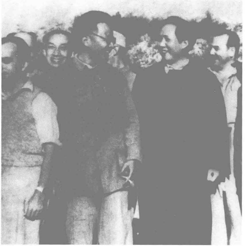
1944年，博古、毛泽东在延安机场欢迎美军观察组