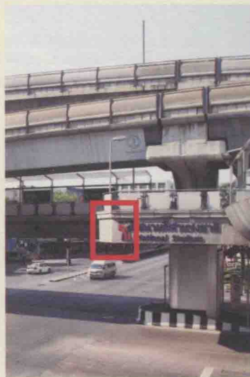
BTS的车站标志由红蓝两色的线条组成，为高架路线。

但要提醒的是，由于轻轨和地铁分属不同公司管理，地铁和轻轨的票卡并不通用，除非确定当天行程只搭乘轻轨或地铁，不然请预估路程远近与车资，买一日票不见得划算。