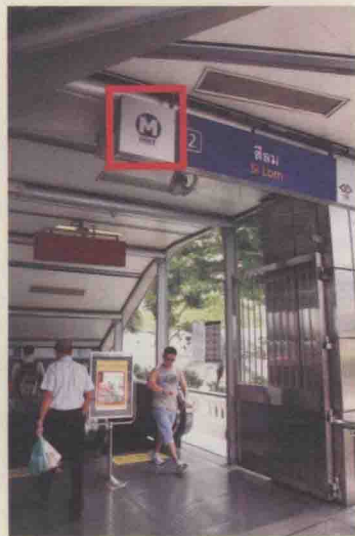
MRT的车站标志以蓝色字母M为标记，路线在地下。