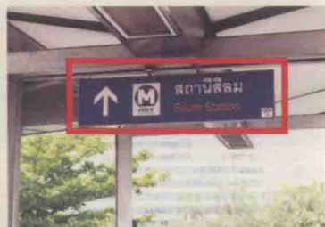
由于MRT和BTS不在共同的车站，在出口处会有进一步的标识标明往转乘方向，也会有英文站名。