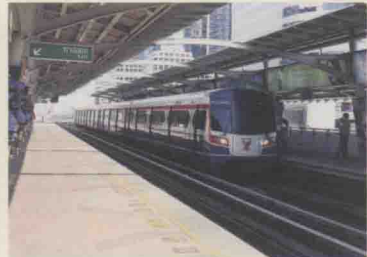
BTS列车，车侧也是以红蓝为主要色彩。