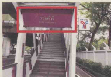
BTS入口处清楚标明了英文站名和BTS标志。另外，须注意不少车站虽在地图上标有标记，但在出口并不会标明出口编号。