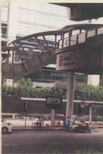
车站出口旁的泰国生活风景

在BTS的高架出口旁，中午会有熟食摊，其他时间会有烤肉串、炸鸡腿、冷饮、水果和卖衣服的小摊贩们聚集，到晚上9、10点都还在营业。嘟嘟车和摩托出租车的司机也会在这里等待载客。