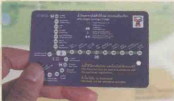
单程票背面附有BTS路线图。

泰国是虔诚的佛教国家，让座的对象除了一般的老弱妇孺和孕妇，车厢内还多了让座给僧侣的标志。如果在车上看到穿着橘色袈裟的和尚，记得入境随俗一下。