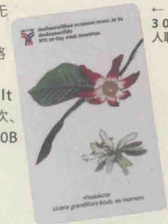
← 轻轨30天成人聪明卡