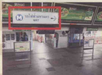
如果是BTS和MRT可以相互转乘的车站，在站内开始就会有路线指示。