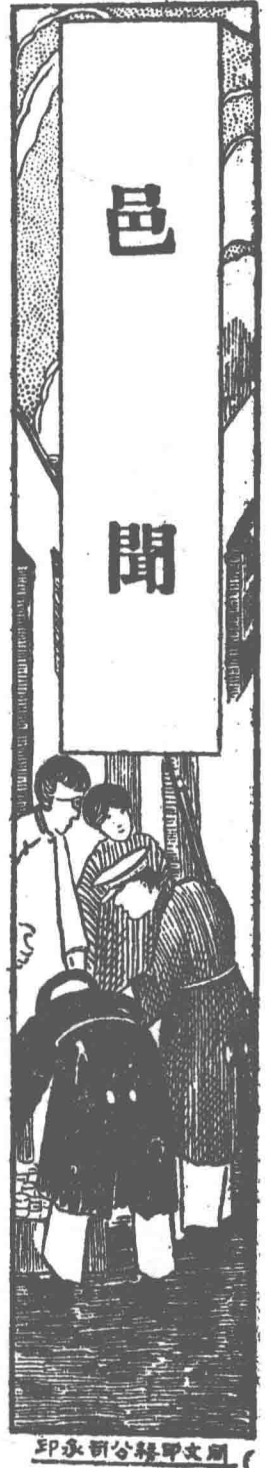
印承新公路甲文開