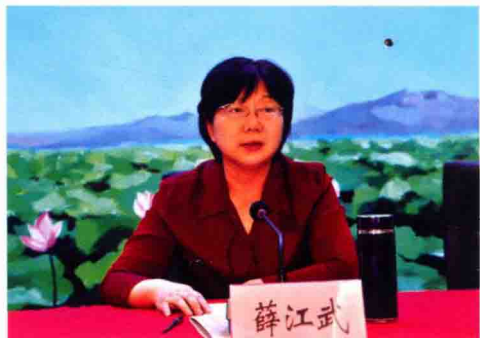
安徽省人民检察院党组书记、检察长 薛江武