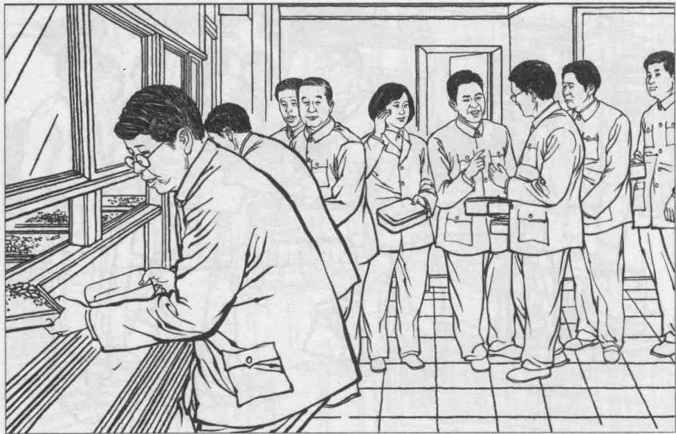
10 父亲不让开小灶，吃饭和大伙儿一样拿着碗上大食堂，一边排队一边与身边的人聊天或谈工作。