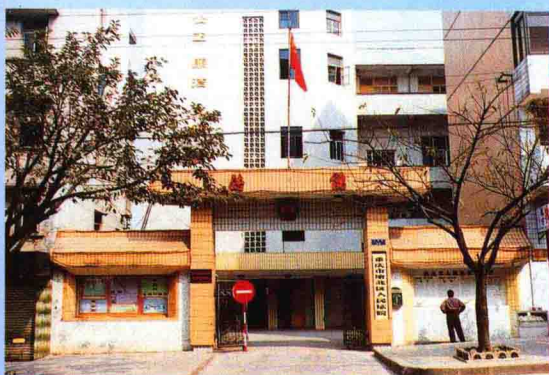
▲ 法院大门 (现正在改建新的审判大楼)

渝北区法院内设25个庭室(科、队),在职干警127人,其中正副院长4人、审判员和助理审判员96人、大专以上文化者112人。