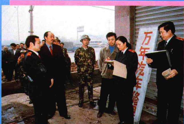
▲ 法院在210国道人和段强制执行非诉行政执行案件。