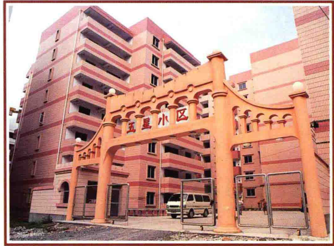
▲ 总公司承修的五星小区住宅楼

金山工业园实行项目业主制，经渝北区人民政府批准（渝北府函 [1999] 50 号文），重庆市渝北区嘉陵房地产开发总公司为金山工业园的项目业主。计划投资 30 亿元人民币。该公司属全民所有制二级房地产开发企业，注册资金 2046 万元。