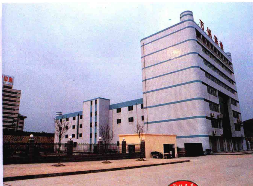
▼ 公司座落在重庆科技产业园

本公司创建于1998年，是集科研、生产为一体的高科技经济实体；是严格按照国家GMP标准设计、建设的现代化中药企业，具有独立法人资格和完备的《药品生产合格证书》与《药品生产许可证》。公司位于重庆科技产业园内，占地面积13166.5m 2 ，环境优雅；一期工程已投资3500万元人民币，总建筑面积12667.6m 2 ，另拥有1万亩中药材种植基地。公司厂房整体结构体现了全封闭、大跨度和人、物分流的特点，洁净区达到10万级标准；拥有国内外先进的中药提取及制剂设备和检测仪器，药物提取过程完全实施管道封闭式自动化控制，确保最终产品质量。公司现已成为日本福田龙株式会社在重庆的定点深加工企业。