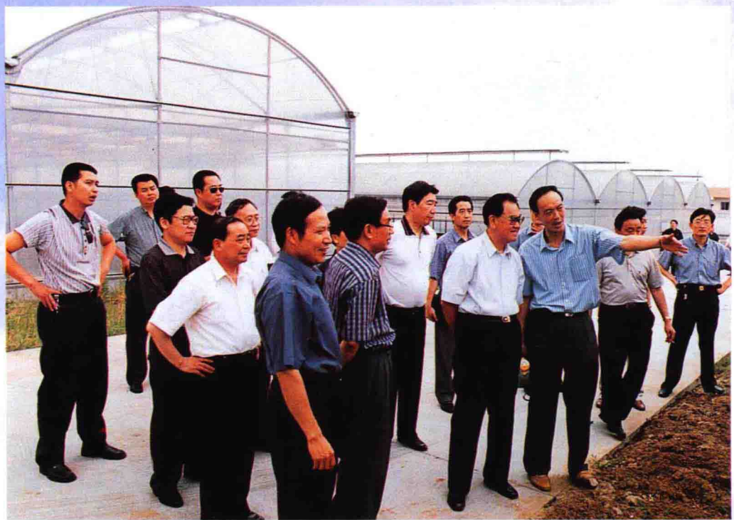
▲ 全国政协副主席毛致用在重庆市渝北区视察重庆现代农业开发园区。