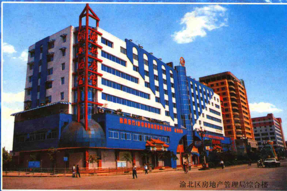
渝北区房地产管理局综合楼