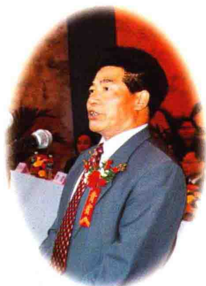
▲ 市委常委税正宽讲话