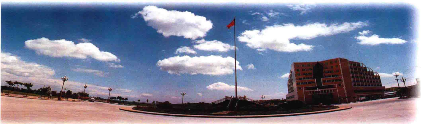
▲ 城南绿梦广场升旗台