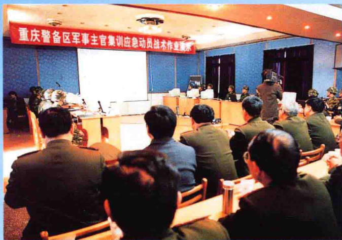
1、重庆警备区首长、机关和全市各区（县、市）人武部长在渝北区人武部机关观看应急动员网上演示。

渝北区人民武装部自1996年收归军队建制后，各项建设特别是管理工作步入新格局。1998年升格为副师级人武部后，成绩斐然。理顺加强了内部管理工作，进行了机关正规化建设，完成了深化民兵工作调整改革任务，提高了民兵预备役组训质量和应付突发事件的能力，加快了以指挥自动化建设为核心的现代化建设，保质