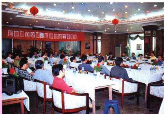
▲ 松树桥立交桥、松牌路竣工座谈会

重庆北部城区是重庆市主城中远期的中央商务区、信息中心、科技文化中心、行政中心和交通枢纽。其规划面积为76平方公里，其中渝北区占46平方公里，含龙溪镇全部及人和镇的部分地区。建成后她将是代表重庆新形象的新城区。