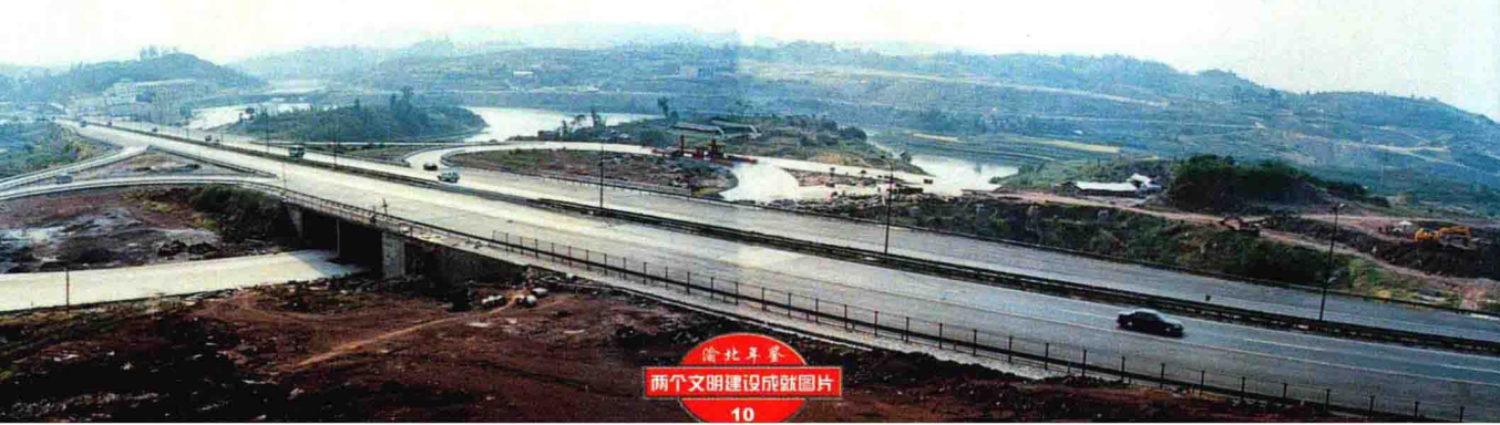
● 开发建设中的210国道宝胜湖立交桥地带

城南开发区建设七年来，累计出让土地3573亩，引进资金20多亿元，修建各类房屋400多栋，总建筑面积达200多万平方米。如今，开发区北部3平方公里的新城已初具规模，5平方公里的基础设施已基本完成。1999年，城南开发建设继续向开发区南部推进，一批有代表性的项目，如重庆计算机软件开发综合工程、重庆海联专修学院、格林梦别墅等相继落户