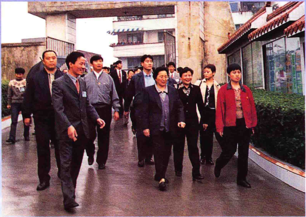
▲ 全国人大常务委员会副委员长何鲁丽在重庆市视察渝北区学校教育工作。图为视察石鞋学校。（石鞋镇供稿）