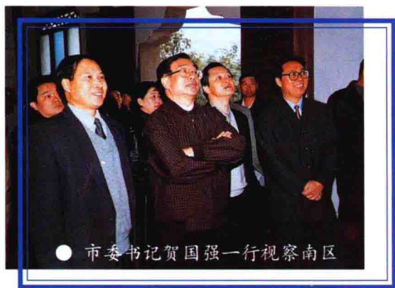
● 市委书记贺国强一行视察南区