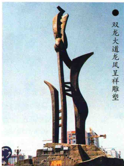
● 双龙大道龙凤呈祥雕塑

顾问：韩国评 地址：渝北区双龙大道城南锦湖路 电话：(023) 67822515 邮编：401120