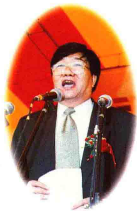
▲ 国家建设部姚兵讲话

重庆市渝北区鸳鸯经济带又名金山工业园，是经重庆市人民政府批准的“市级重点项目”（重府发[1998]215号），规划面积13.11平方公里，由工业区、金融政治文化区和生活服务区三大板块构成。与未来重庆市政治、金融和文化中心的北部新城毗邻，距重庆机场仅7公里，正在兴建44米宽的城市道路横贯园区，交通十分便利。