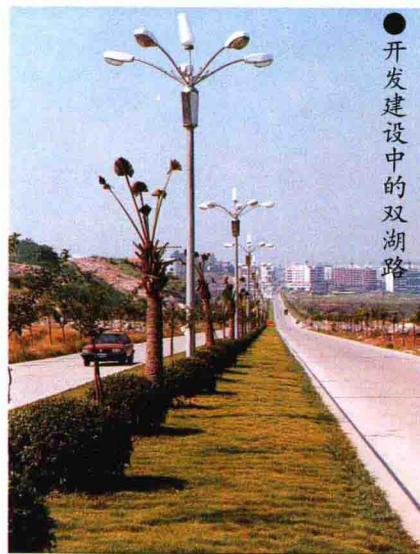
● 开发建设中的双湖路