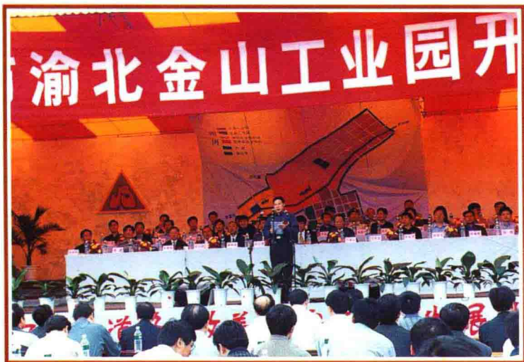
▲ 金山工业园开工庆典