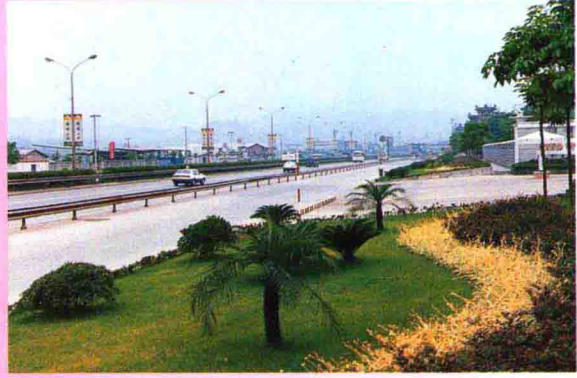
▲ 迎宾大道绿色走廊

建设与社会发展，有力地促进了市、区两个文明建设，繁荣了开发地区的经济，增强了综合实力；地处北城的龙溪、人和二镇的经济社会发展更是突飞猛进，如龙溪镇1999年财政收入比开发前的1984年猛增602倍，城市化水平日益提高，大片美丽的崭新城区不断涌现。