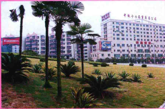
▲ 松树桥立交桥绿化带