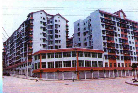
▲ 龙溪镇龙脊22#地块转非居民住宅

北城开发建设带动了渝北区的开放开发，为全区乃至全市的开发工作积累了经验，也为全区的经济与社会发展作出了重大贡献。当前，正以开放、超前、务实的精神和宏大气魄，谋划未来，踏实工作，不断开创新的局面！