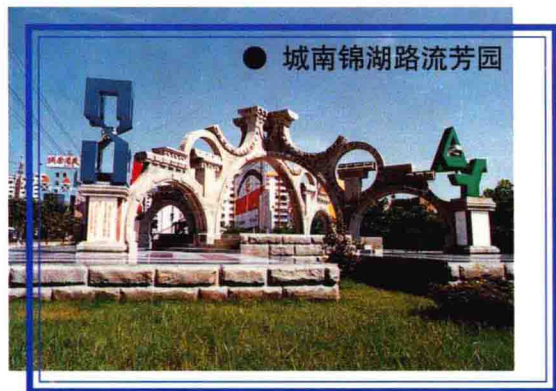
● 城南锦湖路流芳园