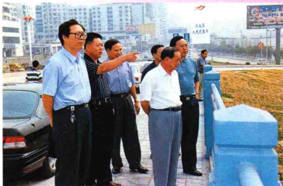
▲ 市、区领导关注北城建设