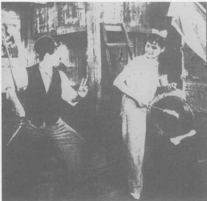
《流亡之歌》剧照。此影片反映沦陷区民众的苦难生活