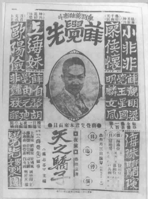
薛觉先20世纪30年代的演出广告