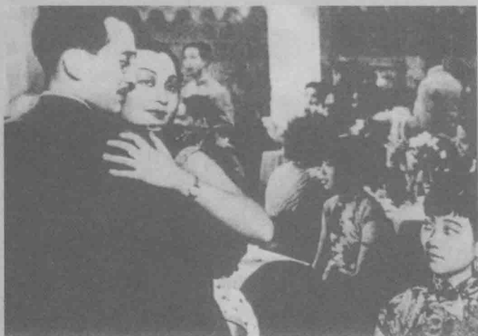
《孤岛天堂》剧照。此影片反应沦陷区民众的反抗精神