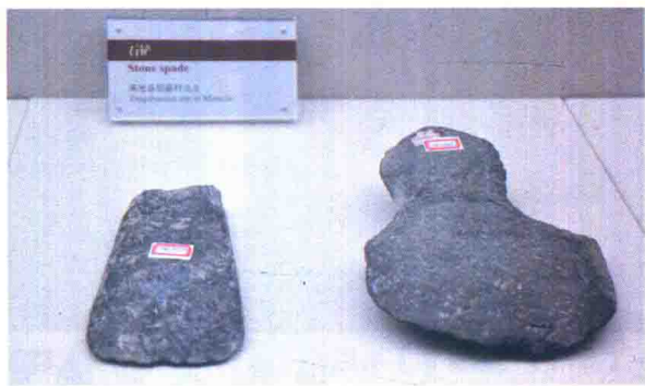
◆ 大汶口遗址出土石器

已发现的距今120万年前旧石器中期人类遗址陕西大荔人、湖北郧县猿人、广东马坝人及山西丁村人等，其出土的石器有三棱器、尖状器、多边圆形、刮削形等。广东柳江人、北京山顶洞人遗址中发现的穿孔骨针、加工过的兽牙、海蚶壳、鱼骨等，表明人们已初步掌握了磨、钻、挖、穿孔等技术。