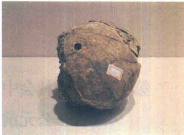
◆ 出土颅骨手术头骨

远古人民在与疾病斗争的实践中，逐渐学会应用石制或骨制工具在身体上实施治疗，这便是砭石，现已出土的砭石其形状多种。这些砭石既可浅刺身体各部又可割治痈疮，甚至还曾用来实施某些外科手术。1995年山东广饶傅家大汶口文化遗址出土了一具距今5000年人类骨骼，其颅骨