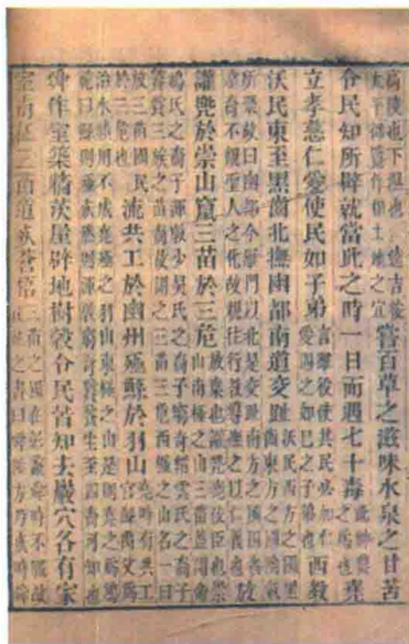
◆ 《淮南子·修务训》书影