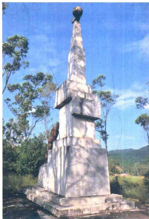
◆ 禄丰古猿遗址纪念碑

人类起源于何处，猿如何变成人，这是许多人都关心的问题。有人说在非洲，有人说在欧洲，有人说在亚洲。我国西南广大地区发现出土的拉玛猿化石说明了我国西南地区位于人类起源的范围内。1965年5月，在元谋的上那蚌村距今大约170万年前的地层中还发现了元谋人的牙齿和石器，进一步说明了这种论点的正确性。