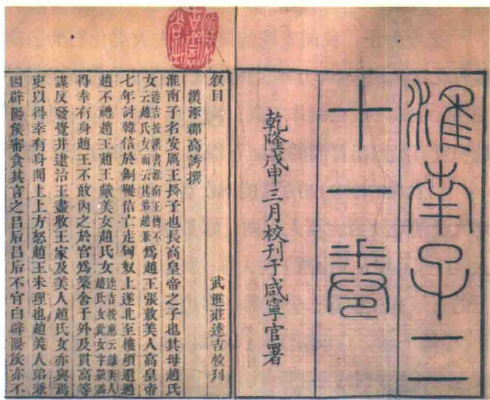
◆ 《淮南子》清乾隆刻本书影

有毒的植物，从而引起呕吐、腹泻，甚至昏迷、死亡。与其相反，有时也会因食用了某些植物，使身体原有的病痛不适减轻甚至消失，或同食一种植物，因量的不同而产生或中毒或减轻病痛的不同效果。这些现象的反复出现，使人们逐渐认识了这些植物的性能及毒性与药性之间的关系，从而有意识地选择食用以减轻病痛，这便是