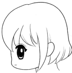
Q版人物的侧面轮廓呈平面，以简单的线条画出即可