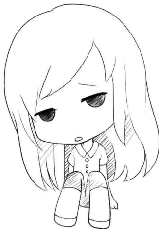
Q版人物脚掌被简化