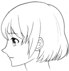
写实人物的侧面轮廓精致，有凹凸变化

写实人物转换成Q版人物后，侧面五官凹凸的轮廓弱化，只需要对脸蛋的凸出进行表现即可。