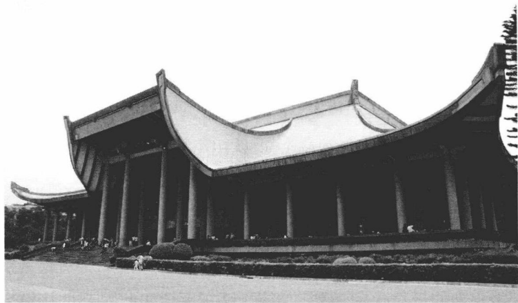
孙中山当年在台湾的住地现在变成了纪念馆