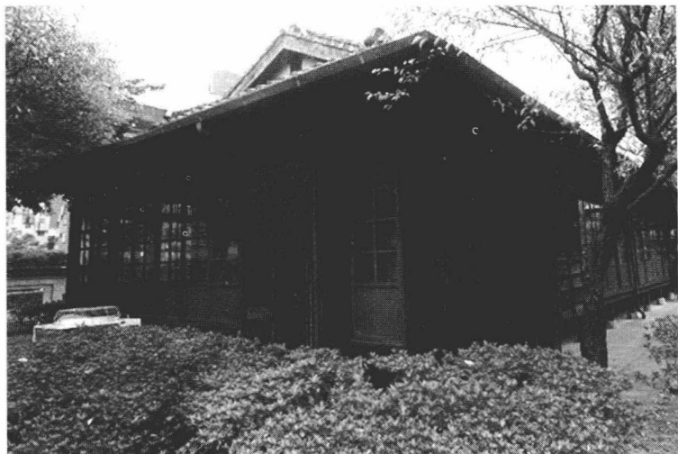
台北“梅屋敷”曾是孙中山先生从事反清强国活动的一处重要场所