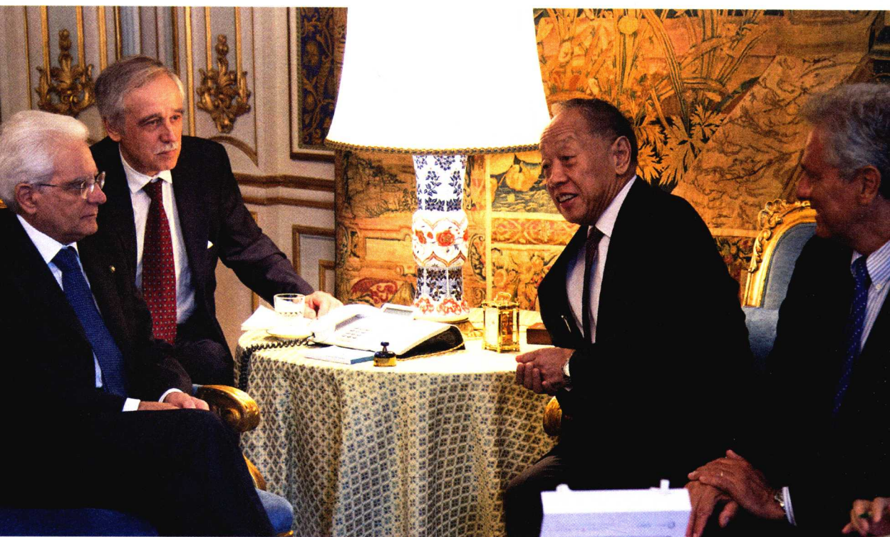
2015年7月，中国公共外交协会会长李肇星在罗马拜会意大利总统马塔雷拉。