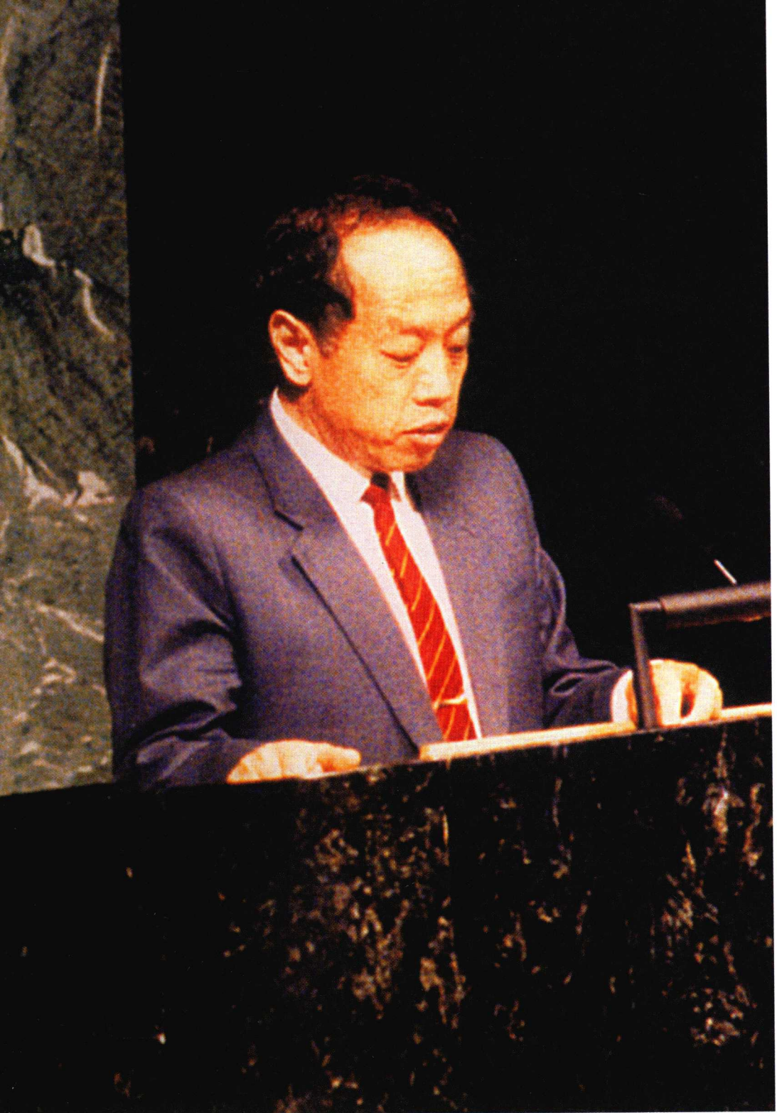
1994年，秦力真的女婿李肇星代表中国政府在联合国大会上发言。