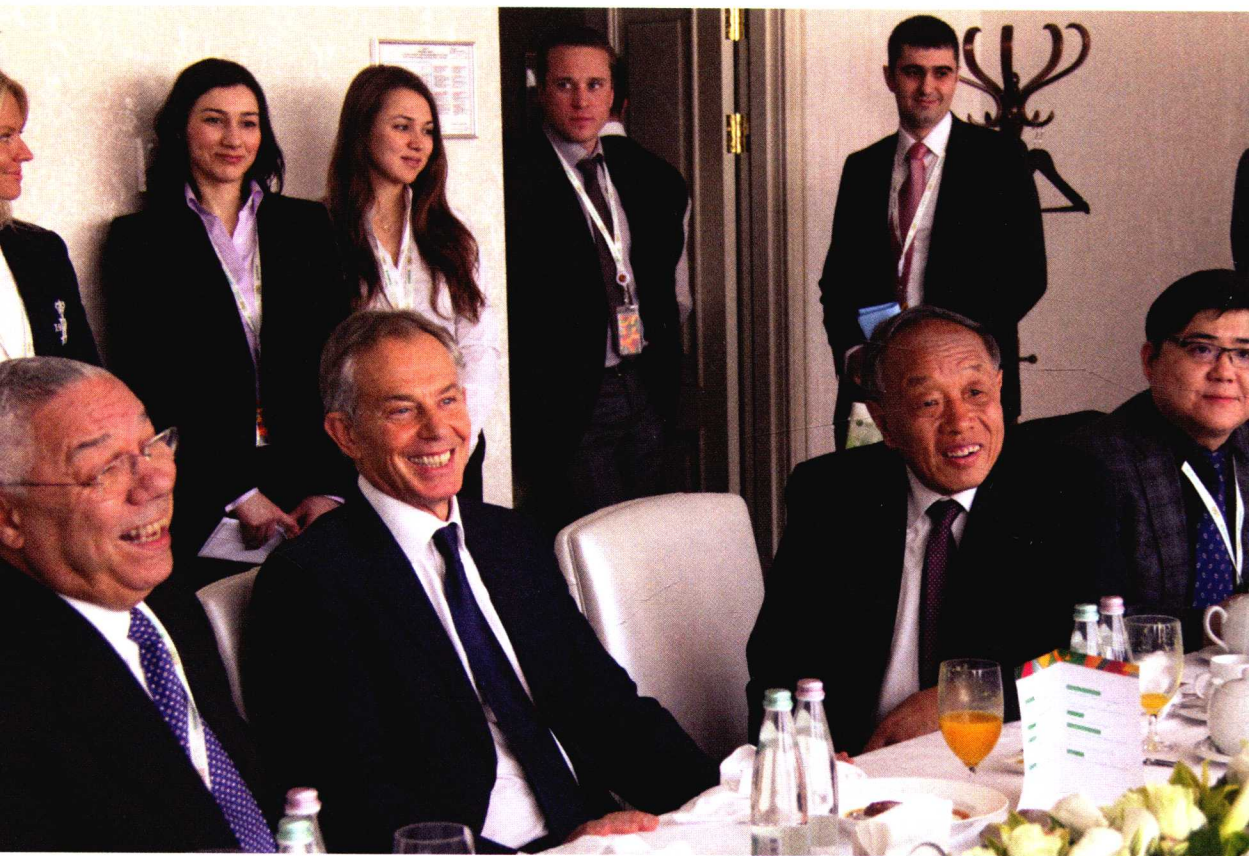
2013年4月，中国公共外交协会会长李肇星与美国前国务卿鲍威尔、英国前首相布莱尔出席俄罗斯论坛。