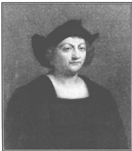
图 1-1 雕刻师所塑造的哥伦布的形象

考古人类学家布鲁斯·罗斯柴尔德和同事在哥伦布与船员扎营的伊斯帕尼奥拉岛，发现显然感染梅毒的人骨，因此美洲是梅毒起源地的可能性较高。在哥伦布时代之前欧洲发现唯一受到梅毒侵害的骨骸，很可能是另一种螺旋体疾病雅司症所致。如果这种说法属实，那么蹂躏欧洲的梅毒就是 15 世纪冒险家所带回来的，他们航行的发现，不仅是经济、文化与精神上的大变动，也引进改变欧洲历史的疾病。