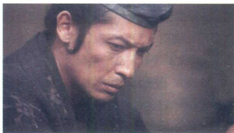
◎ 大河剧《平清盛》中由玉木宏饰演的源义朝