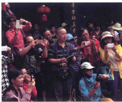
记者们在诺邓千年古镇采访。