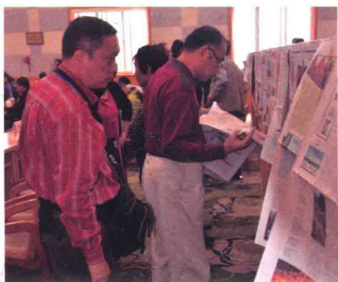
参加中国报纸副刊研究会 2014 年年会的报纸副刊编辑记者认真看细心品报纸副刊优秀版面。