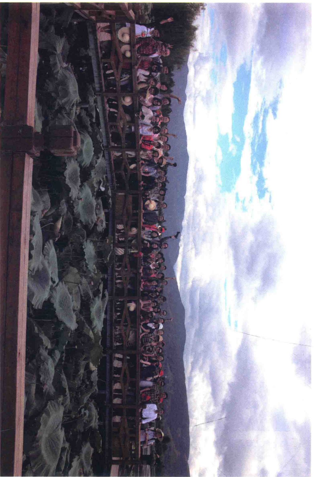
洱源此碧湖的美景令记者们陶醉，有人提出在这里照个“全家福”吧，同行们纷纷响应，留下了这个美丽的瞬间。