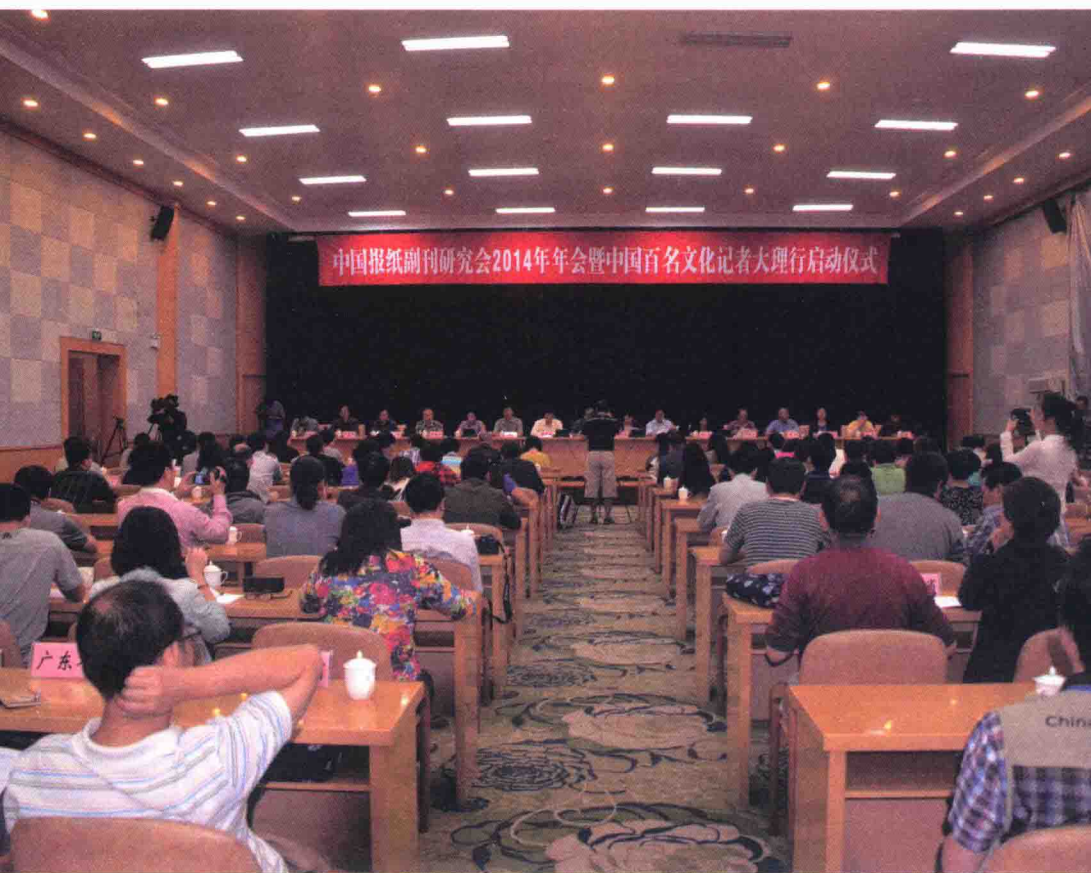
中国报纸副刊研究会 2014 年年会暨百名文化记者大理采风启动仪式会场。