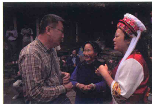
记者们在具有浓郁白族风情的喜洲、凤羽古镇采访。