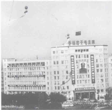
1969年春季第25届广交会起义路展馆。