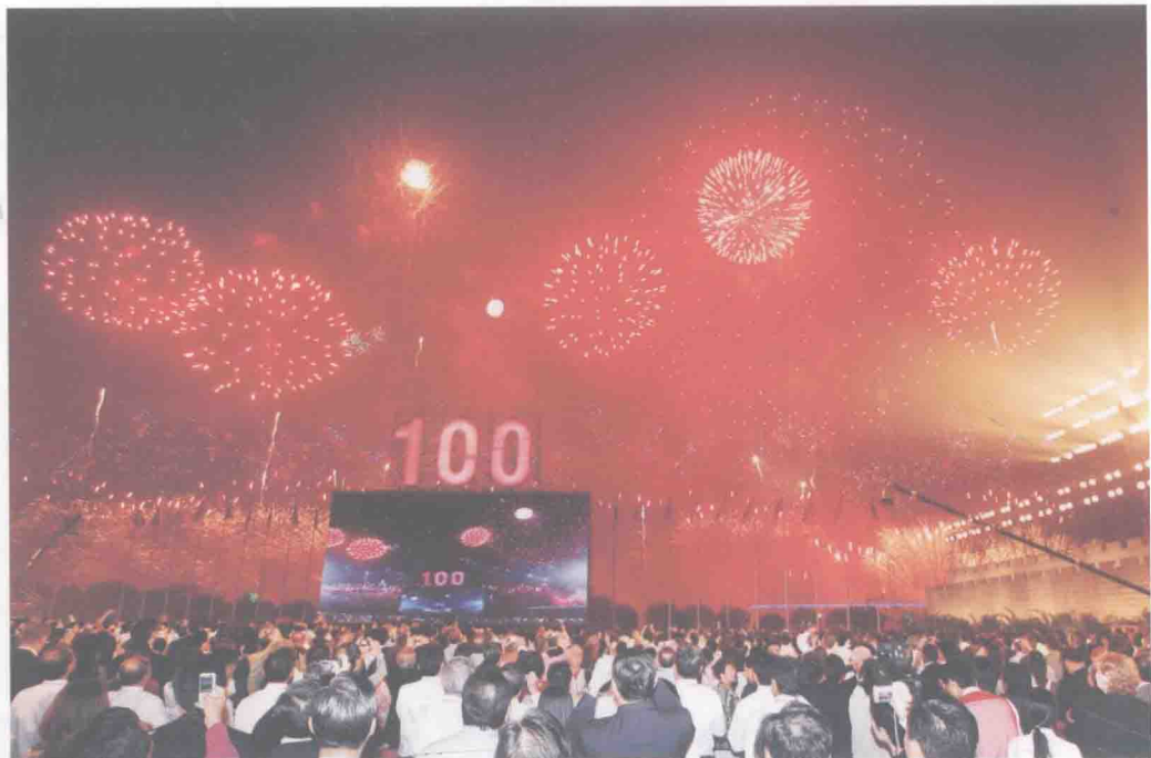
第100届广交会庆典晚会璀璨生辉的现场。