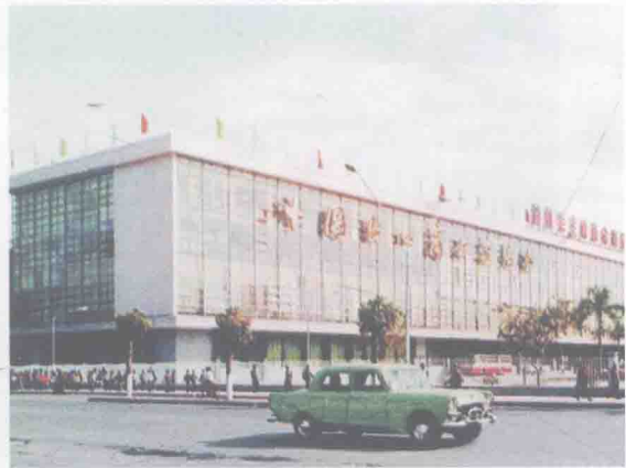
现流花路上的广交会原展馆，是原中苏友好大厦所在地，在1972年底动工，1974年3月竣工。

2008年10月，中国进出口商品交易会（简称“广交会”）琶洲展馆A、B、C区相继竣工，自此，广交会整体搬迁琶洲，完成了自1957年创办以来的第四次迁址。从第104届中国进出口商品交易会开始，广交会全部移师琶洲展馆。