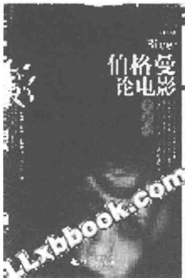
《伯格曼论电影》封面

伯格曼生前曾撰写并出版的重要著作 8 本,其中 2 部翻译为中文,即《伯格曼论电影》(韩良忆等译)、《魔灯:伯格曼自传》(刘森尧译/张红军译);另外,伯格曼自成名之后至 2003 年之前,先后接受了 11 次采访,其中 4 次访谈录被翻译为中文《伯格曼谈艺录》(邵牧君译)、《英格玛·伯格曼谈生活与创作》(章杉译)、《英格玛·伯格曼访谈录》(沈语冰译)、《与英格玛·伯格曼的谈话》(成晓虹译)。这些材料,都成为研究伯格曼的重要参考,受到研究者们的重视。