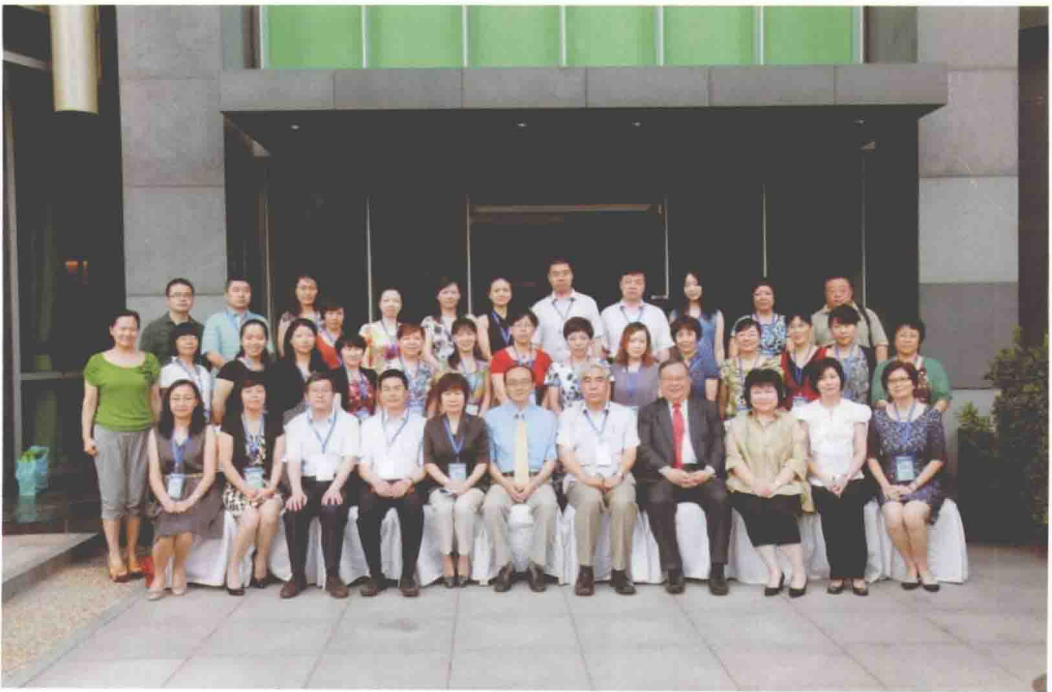
2012年8月9日，中国肿瘤医院患者服务中心启动暨培训会，中国医学科学院肿瘤医院成立全国首家肿瘤专科医院患者服务中心