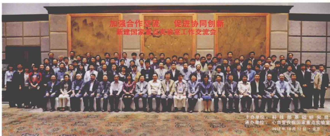
2012年10月11日至12日，由科技部主办、心血管疾病国家重点实验室承办的新建国家重点实验室工作交流会在京胜利召开