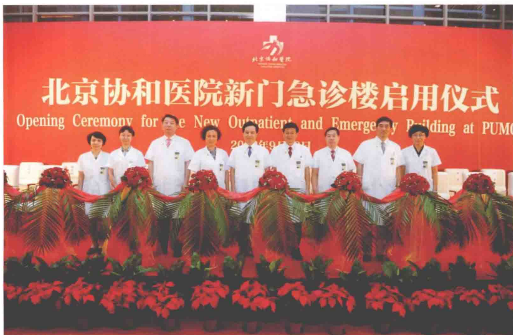
2012年9月28日，北京协和医院新门急诊楼启用仪式（北区新门诊楼）