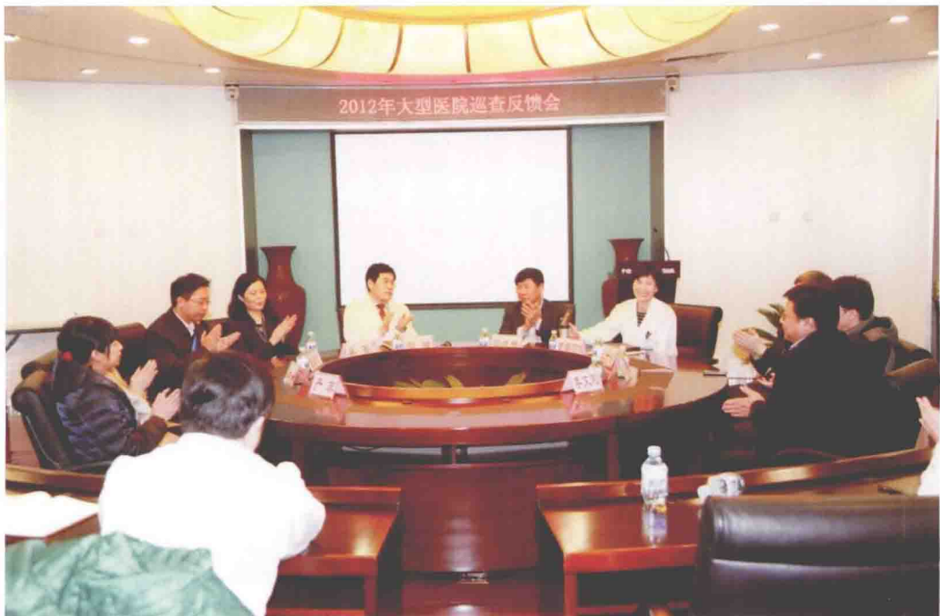
2012年12月20~21日，中国医学科学院肿瘤医院接受卫生部“大型医院巡查”检查工作