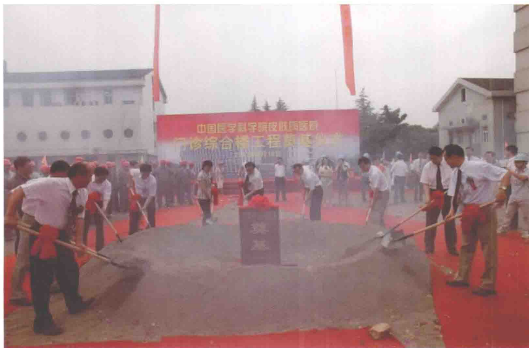
2012年6月18日，皮肤病医院门诊综合楼工程奠基仪式隆重举行