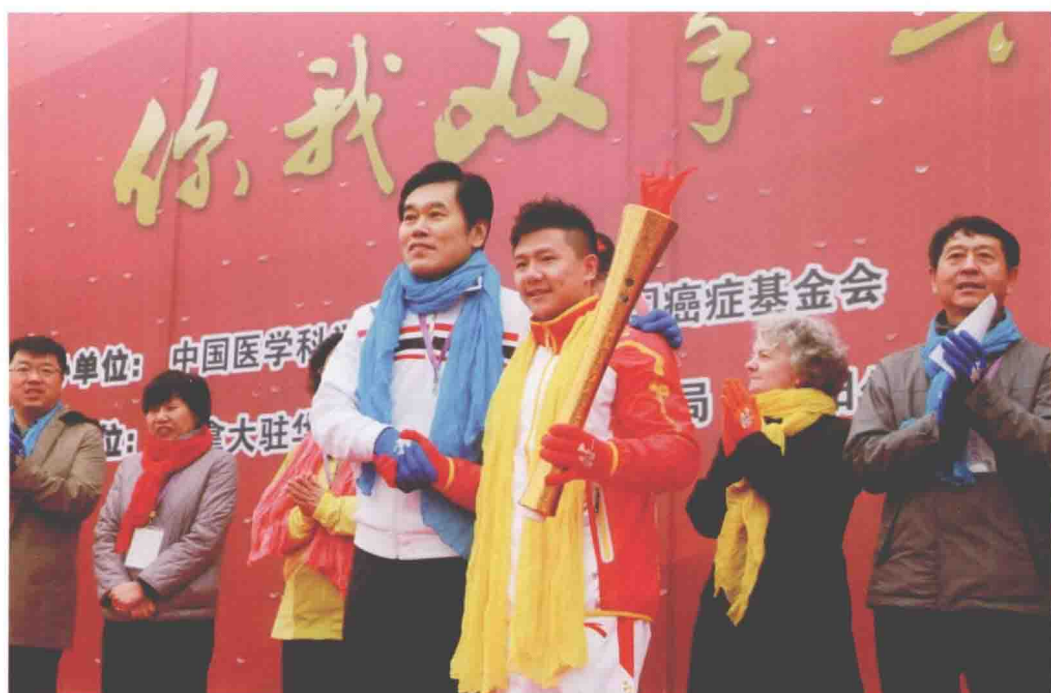
2012年11月3日，中国医学科学院肿瘤医院举行第14届“北京希望马拉松——为癌症患者及癌症防治研究募捐义跑”活动