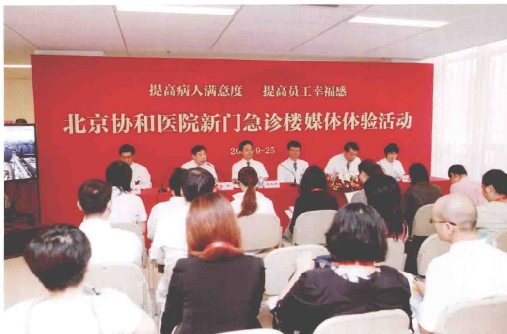
2012年9月25日，北京协和医院在新门急诊楼一层举行新门急诊楼媒体体验活动