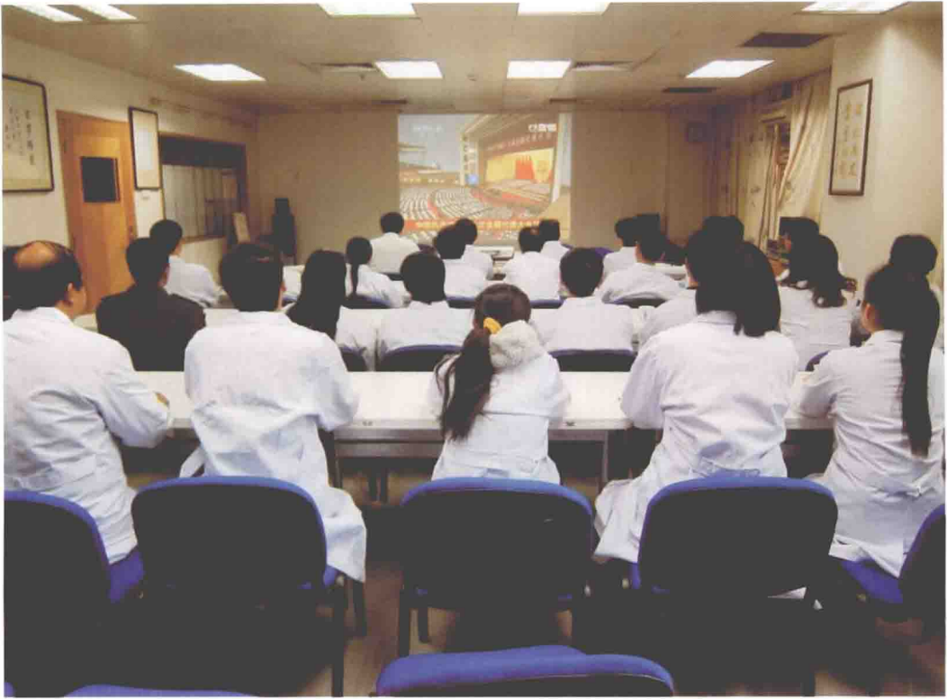
2012年11月8日，微循环所全体师生在三层报告厅集中收看中国共产党第十八次全国代表大会开幕的直播盛况