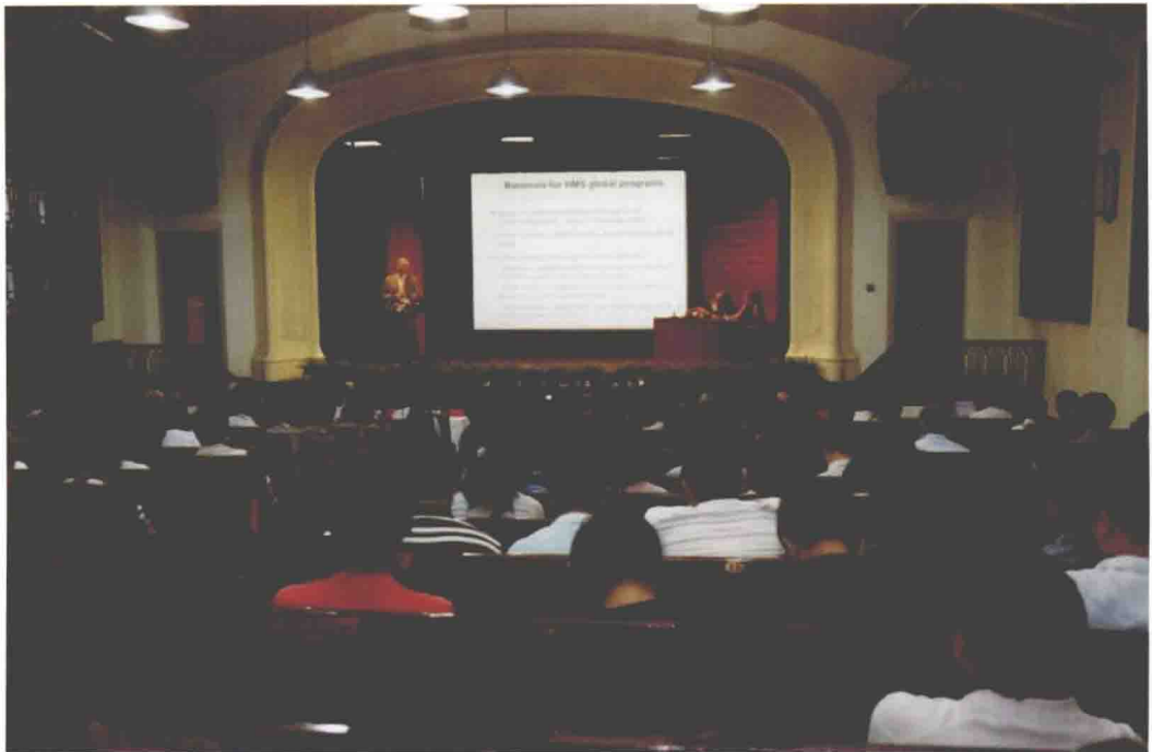
2012年9月19日上午，“第五届协和国际医学教育研讨会”在协和礼堂召开