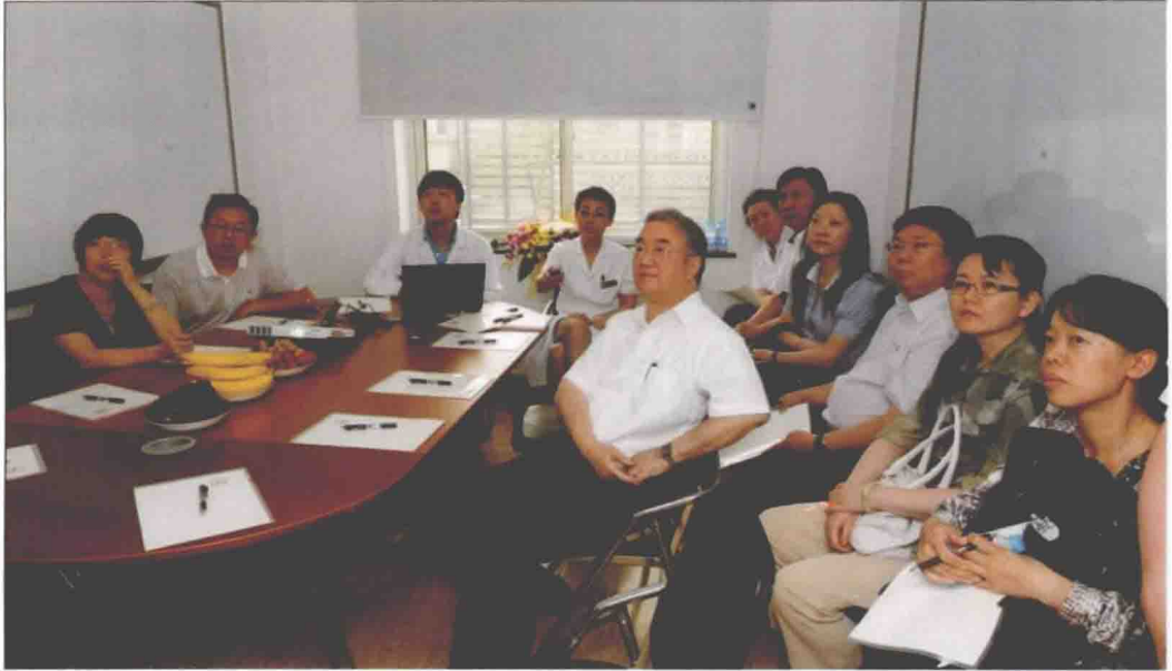
2012年7月19日，全国人大常委会副委员长桑国卫率领卫生部、科技部等领导来阜外医院就“十二五”期间的GCP建设进行调研