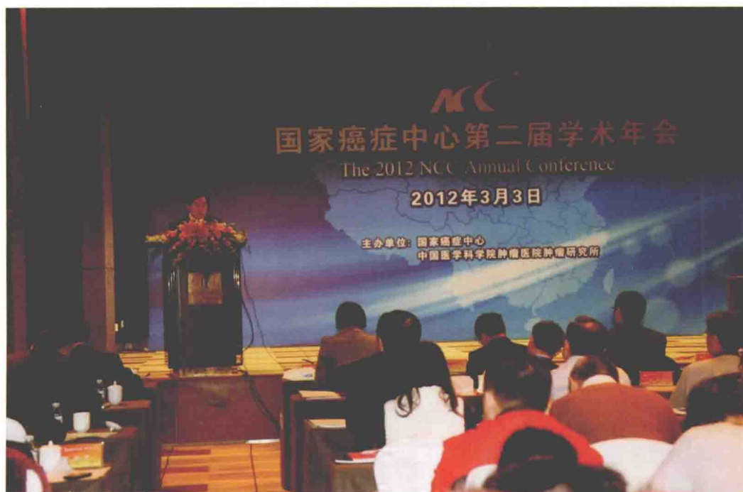
2012年3月3日，中国医学科学院肿瘤医院召开国家癌症中心第二届学术年会