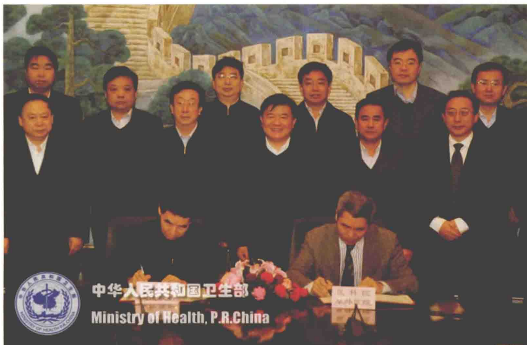
2012年2月14日，河南省人民政府、中国医学科学院阜外心血管病医院在北京举行合作共建框架协议签字仪式