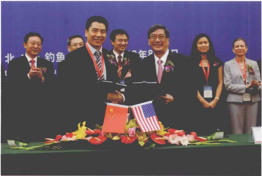
2012年8月1日，国家心血管病中心阜外心血管病医院与默克实验室合作签字仪式在钓鱼台国宾馆隆重举行