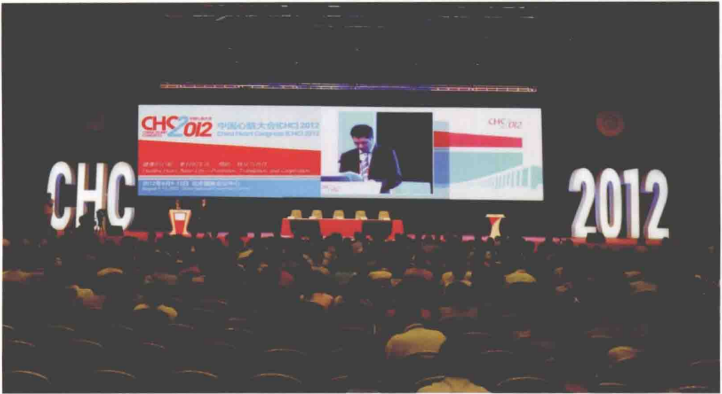
2012年8月9~12日，中国心脏大会2012在国家会议中心隆重召开