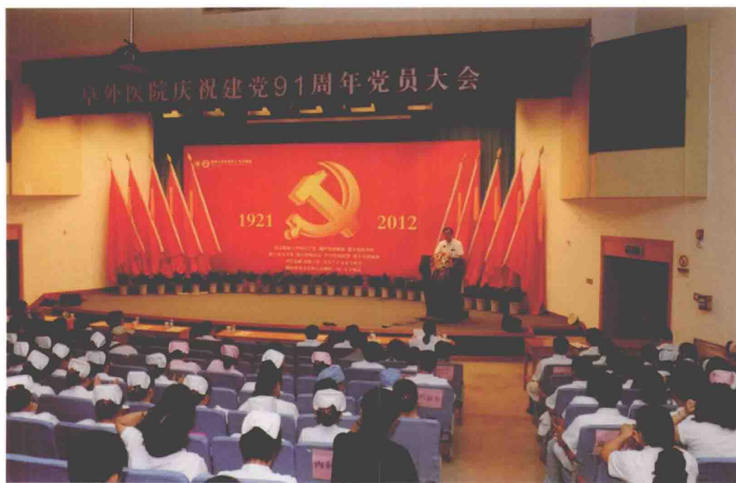
2012年6月29日，阜外医院隆重召开庆祝中国共产党成立91周年党员大会