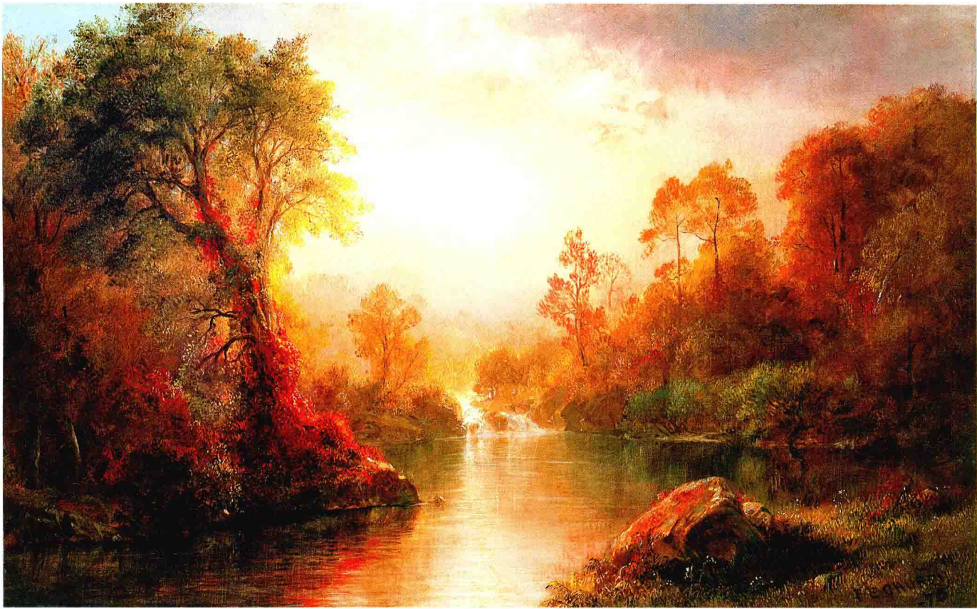
弗雷德里克·埃德温·丘奇 NO. 1