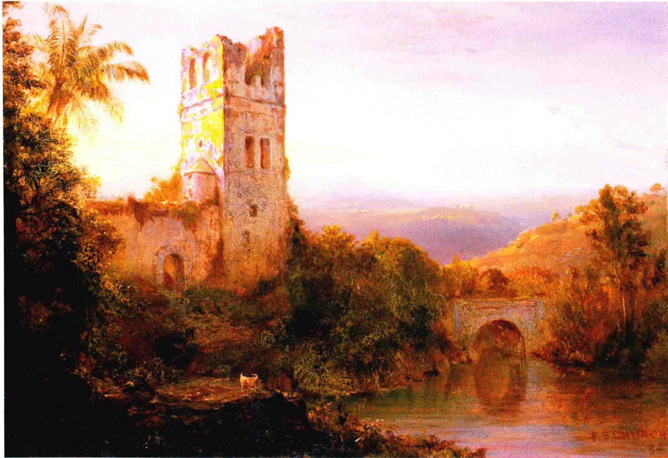
弗雷德里克·埃德温·丘奇 NO. 2