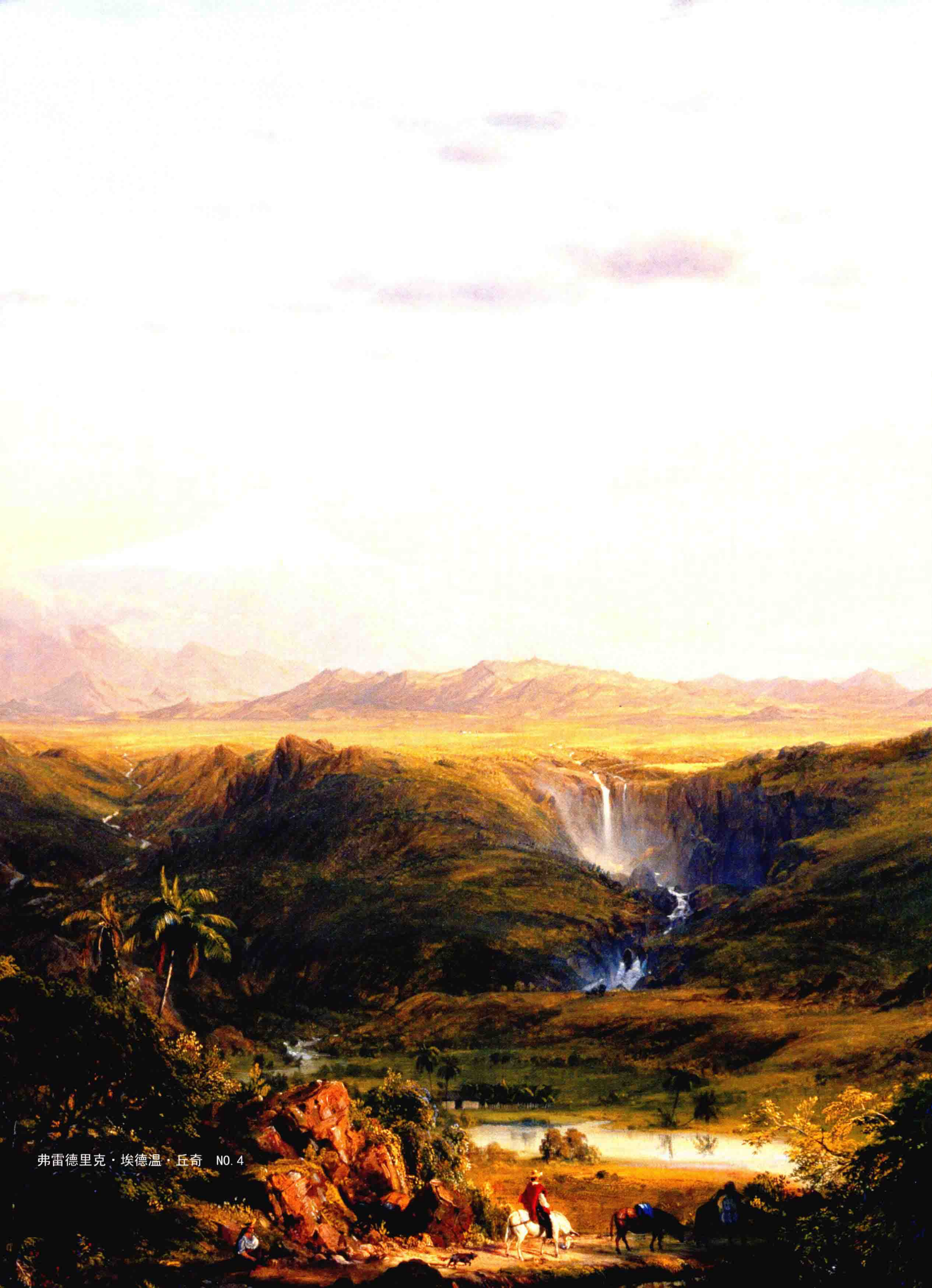
弗雷德里克·埃德温·丘奇 NO. 4