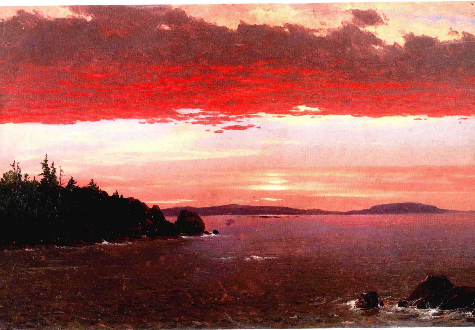
弗雷德里克·埃德温·丘奇 NO. 8