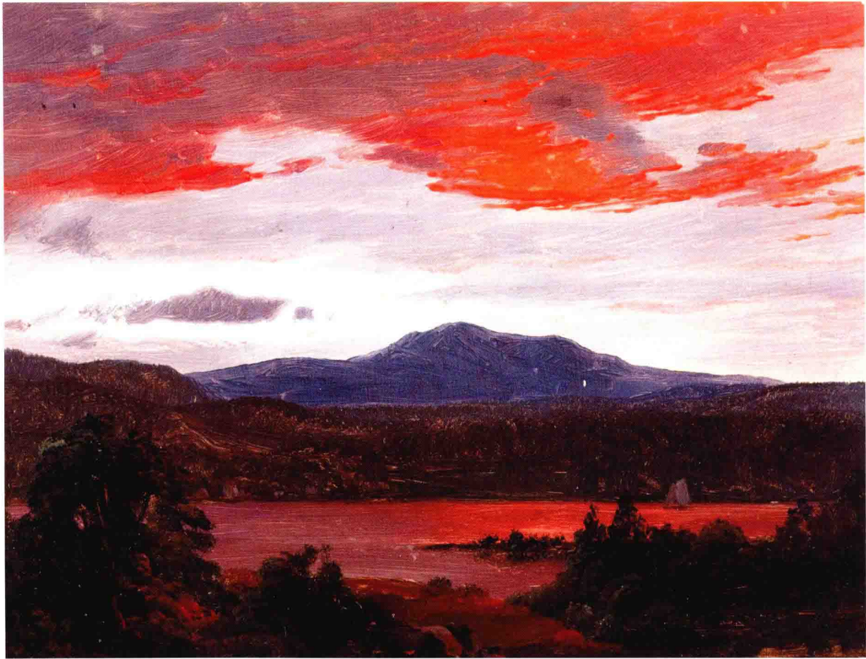
弗雷德里克·埃德温·丘奇 NO. 7