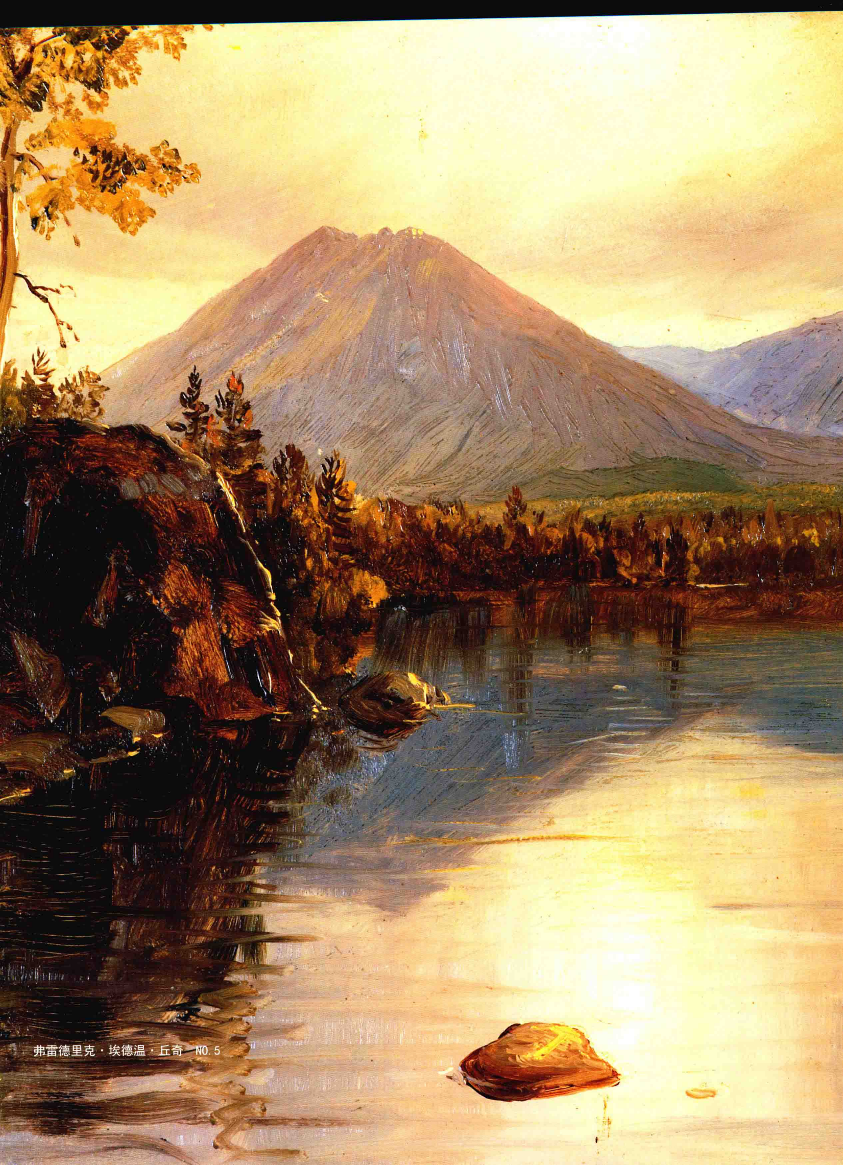
弗雷德里克·埃德温·丘奇 NO. 5