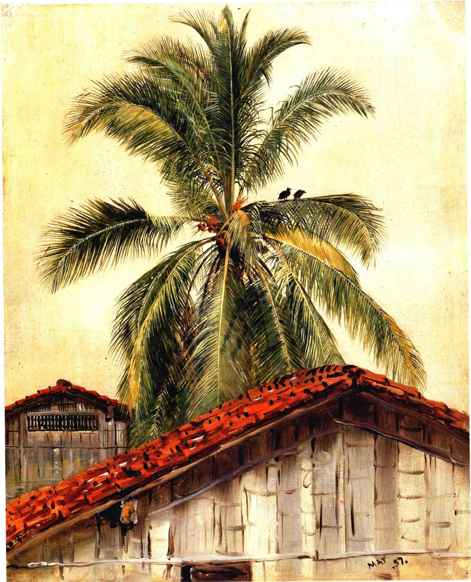
弗雷德里克·埃德温·丘奇 NO. 3