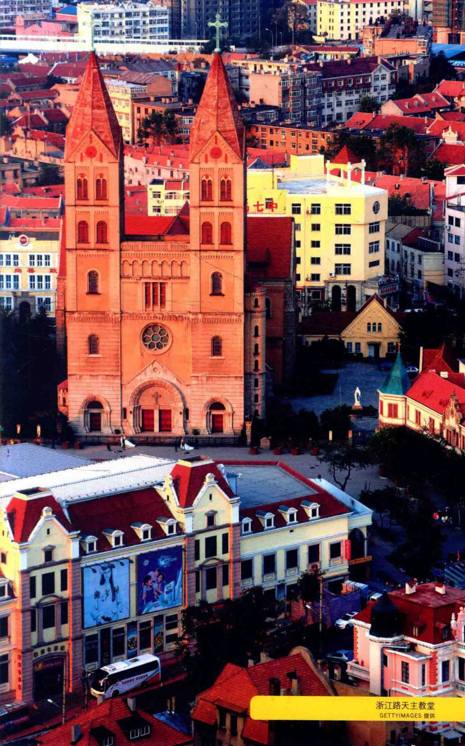
浙江路天主教堂