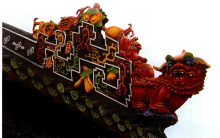
首进中路南面垂脊

独角狮是岭南建筑独有的建筑装饰物。它一般装饰于山墙垂脊前沿上，全身朱红色，独角，状若凌空而下，气势雄伟。这种独角狮造型是根据佛山民间传说而来的。传说明代初年，佛山地区出现一头怪兽，吞食禽畜，毁坏农田，给村民带来严重灾害，后来人们想出“以怪治怪”的方法，请艺人用竹篾扎成一只形状怪异凶猛的独角狮，当怪兽出现的时候，村民便敲锣打鼓，燃放鞭炮，舞动独角狮朝怪兽冲去，果然把怪兽吓跑，从此百姓又过上了太平的日子，寓意辟邪保平安的瑞兽独角狮因而在民间建筑中广为应用。