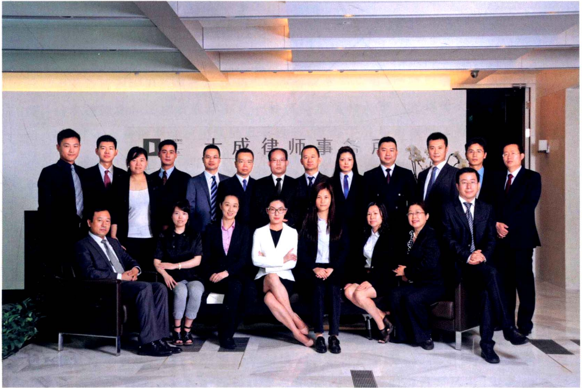
北京大成律师事务所刑事部合影