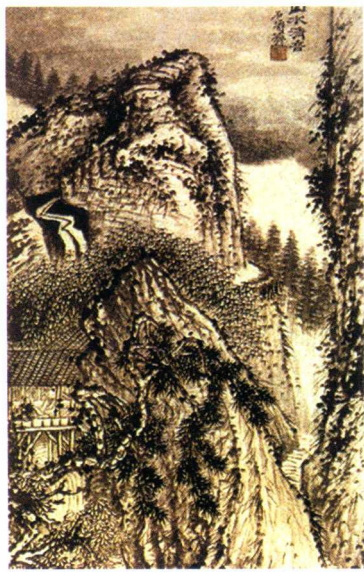
(小写意例图) 作者:石涛(五清)

以上是比较常见的古风技法，这些也会运用到现代古风绘制当中。传统古风绘制在着装、建筑等方面也比较考究，本书后面也会详细讲解古风服饰的特点。