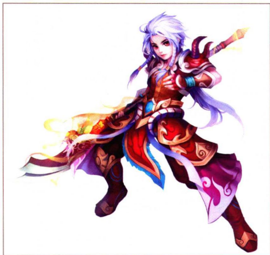
厚涂法 Q 版 (神魔遮天)

厚涂法结合了西方油画的表现形式，其用笔厚重，突出结构与光影。厚涂法普遍应用色块起稿的手法，比较有利于表现大气且富有张力的画面，大家在电脑上常看到的一些游戏宣传图就多是采用的厚涂法。