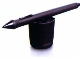
影拓系列数位板和压感笔