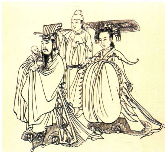
(白描例图) 作者: 吴道子 (唐)

工笔，顾名思义就是用工整、细腻的技术来创作，装饰性比较强，其中也分白描和重彩两种。白描是用线来表现事物的某一动态、风貌、神情，接近我们现在所说的线稿；而重彩则着重用色彩的搭配及渲染方式，敦煌壁画就是以工笔重彩的手法表现的。