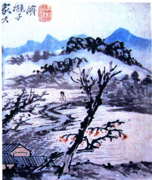
(大写意例图) 作者:石涛(清)

写意不同于工笔的严谨，写意比较随性，注重神态的表现，以及作者内心的思想感受，不拘泥于结构形式。写意也分为大写意和小写意两种，大写意如上所述，小写意还是比较细腻的，其表现形式介于工笔和大写意之间。