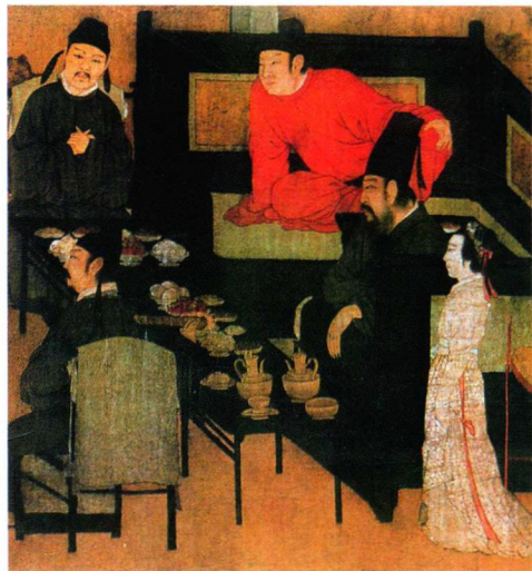
(重彩例图) 作者: 顾闳中 (五代南唐)