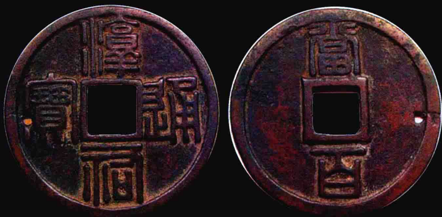
篆書淳 當百大錢 3 萬元