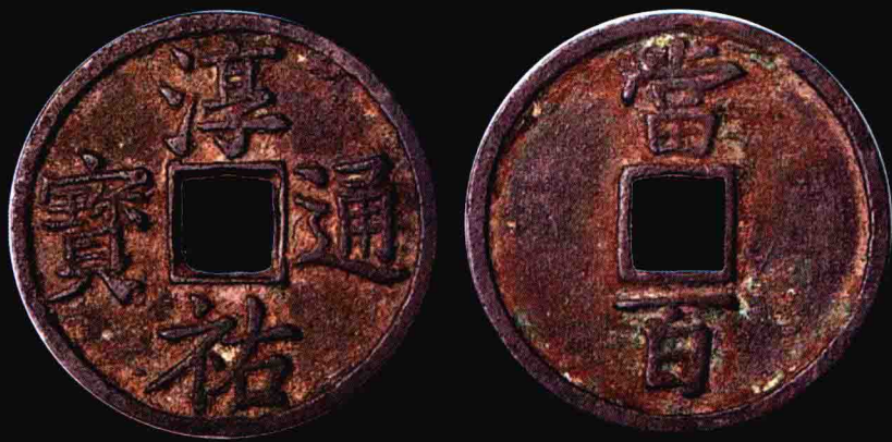
楷書淳 當百大錢 3 000 元