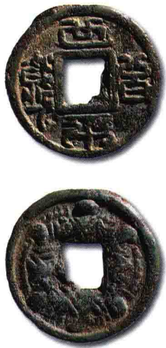
◎ 世平百钱背水波纹

月纹是指钱面、背上凸起的形似月牙的纹饰，又称甲纹、月痕。自唐开元通宝以后，广泛使用，且多变。圆弧向上者称仰月，向下