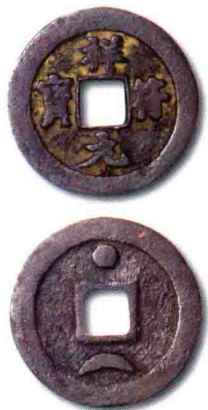
◎ 祥符元宝背巨星月 珍 8 级

余榴梁评述：北宋真宗赵恒大中祥符元年（1008年）铸，有祥符元宝和祥符通宝，背星月铸数稀少，存世珍罕。