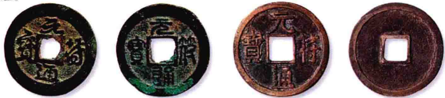
行书、篆书元符通宝 5元

面文在钱文中占大多数，反映了钱币的基本性质。从钱文性质的变化看，可把钱币分成纪重钱、纪地钱、纪值钱、纪年号钱、纪国号钱、纪王号钱、纪监钱、纪局钱和纪数钱等。背文始见于战国，三国时蜀国铸“犍为五铢”，钱背加注“为”字，是圆钱中最早的纪地背文。重文为钱范错位造成，其特征是钱文双重。传形源于刻范时误将文字位置刻反，铸成后文字位置颠倒，成传形，多见于六朝时期的钱币。