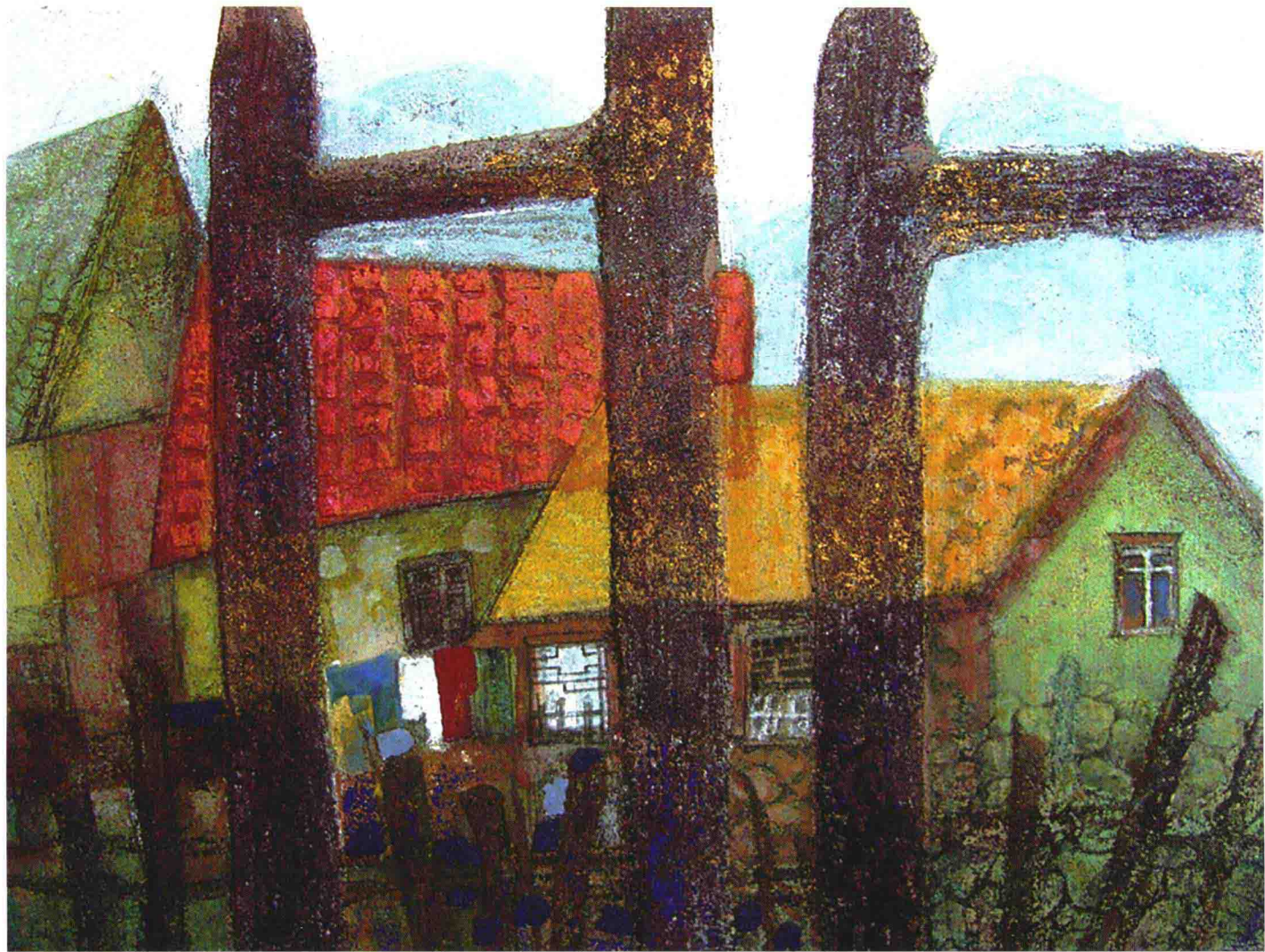
小屋 作者：董云霞 材料：画布 颗粒颜料 尺寸：80 × 80cm 年代：2003