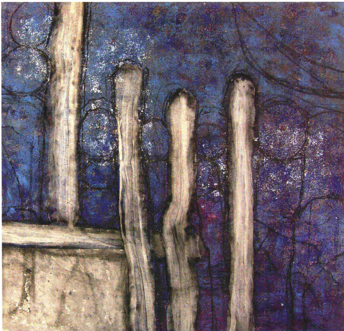
三、用纱布贴出肌理效果，有的地方用宣纸贴出来。