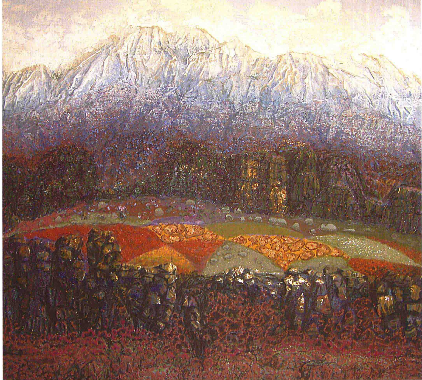
秋 作者：董云霞 材料：画布 颗粒颜料 尺寸：80 × 80cm 年代：2005