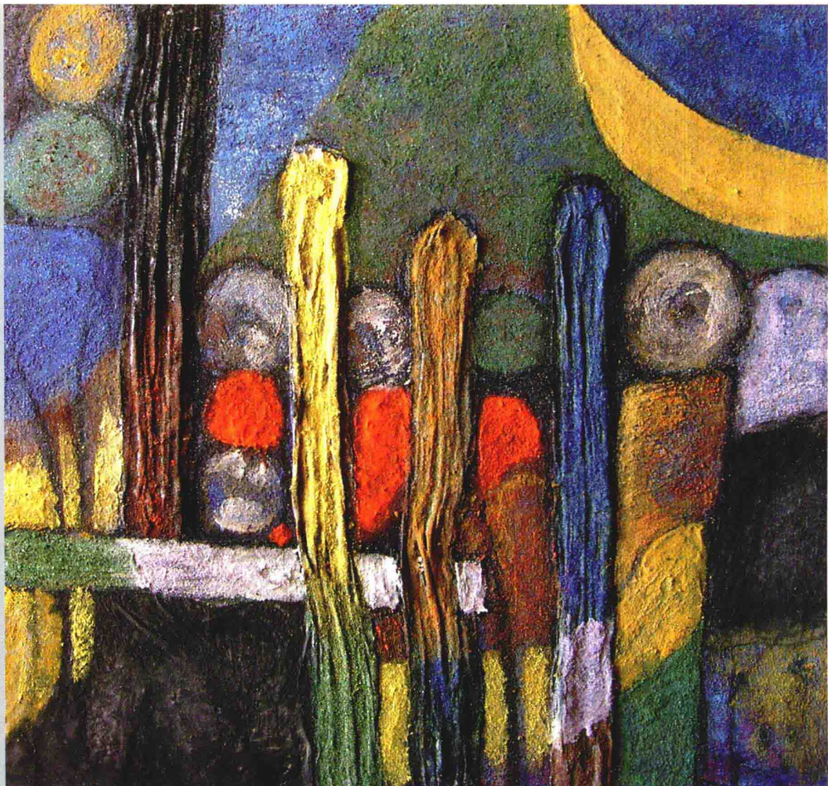
七. 在绘制栅栏，圆木的处理上，底色为大红、绿，以洗的办法画出圆木头的质感。使肌理更加丰富，整体画面和谐。